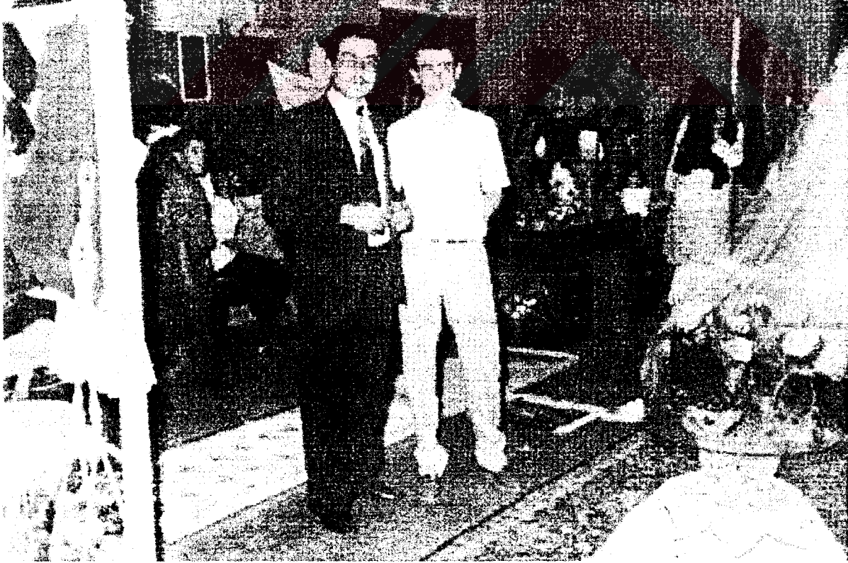
Düğün evinde bir görüntü