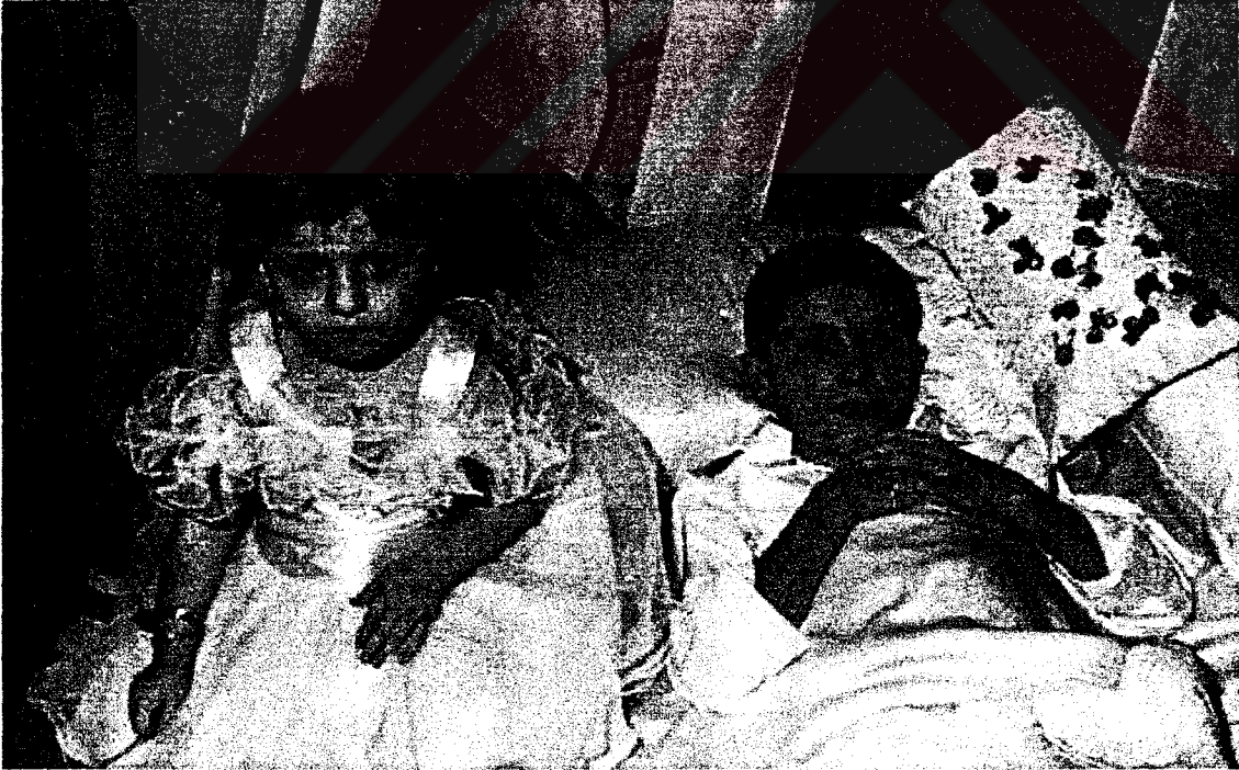
Sünnet edilen çocuk baş ucundaki takıları ile birlikte