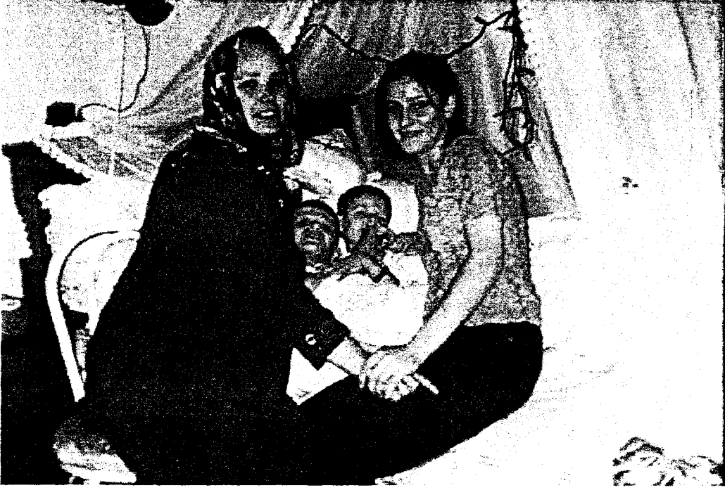
Sünnetli çocuklar annesi ve ablası ile birlikte iken