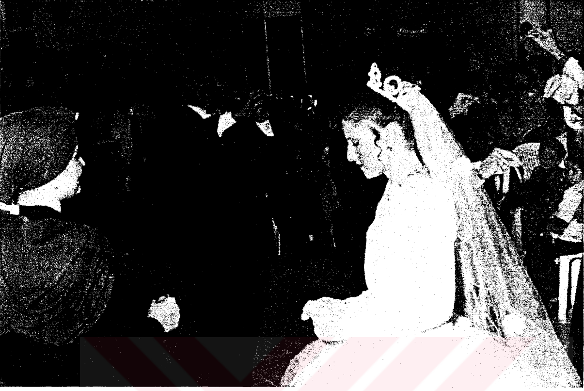
Salonda çekilmiş bir düğün görüntüsü