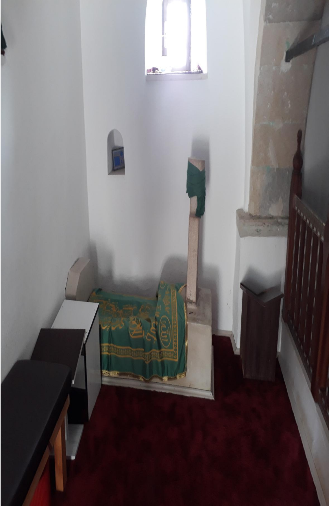
11- Osman Bedrüddin Erzurumi Türbesi ( Türbe içi Kabr-i Şerifleri Resim-4)