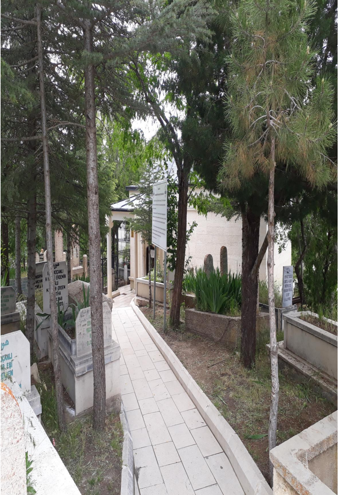
3- Osman Bedrüddin Erzurumî'nin Türbesinin Dıştan Yakından Görünümü