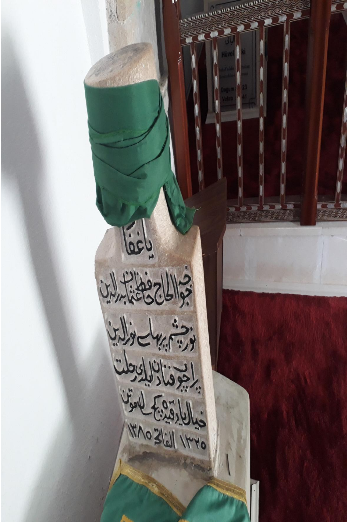
9- Osman Bedrüddin Erzurumi Türbesi ( Türbe içi Kabr-i Şerifleri Resim-3)