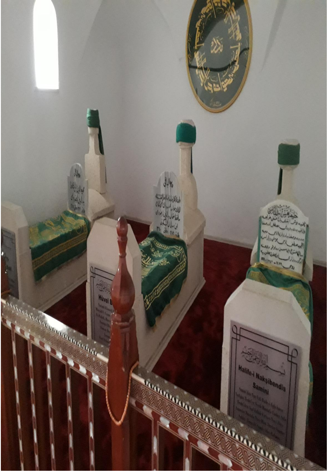
13- Osman Bedrüddin Erzurumi Türbesi ( Talebelerinin Kabr-i Şerifleri Resim-1)