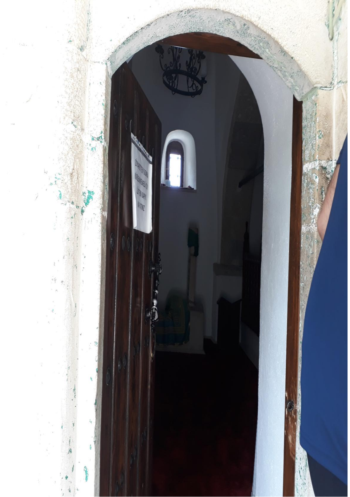
6-Osman Bedrüddin Erzurumi Türbesi (Giriş kapısından bir görünüm)