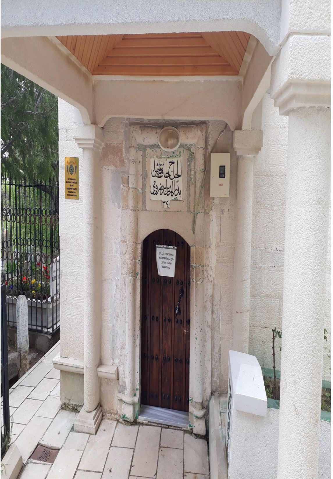
5- Osman Bedrüddin Erzurumi Türbesi (Türbe Giriş Kapısı)