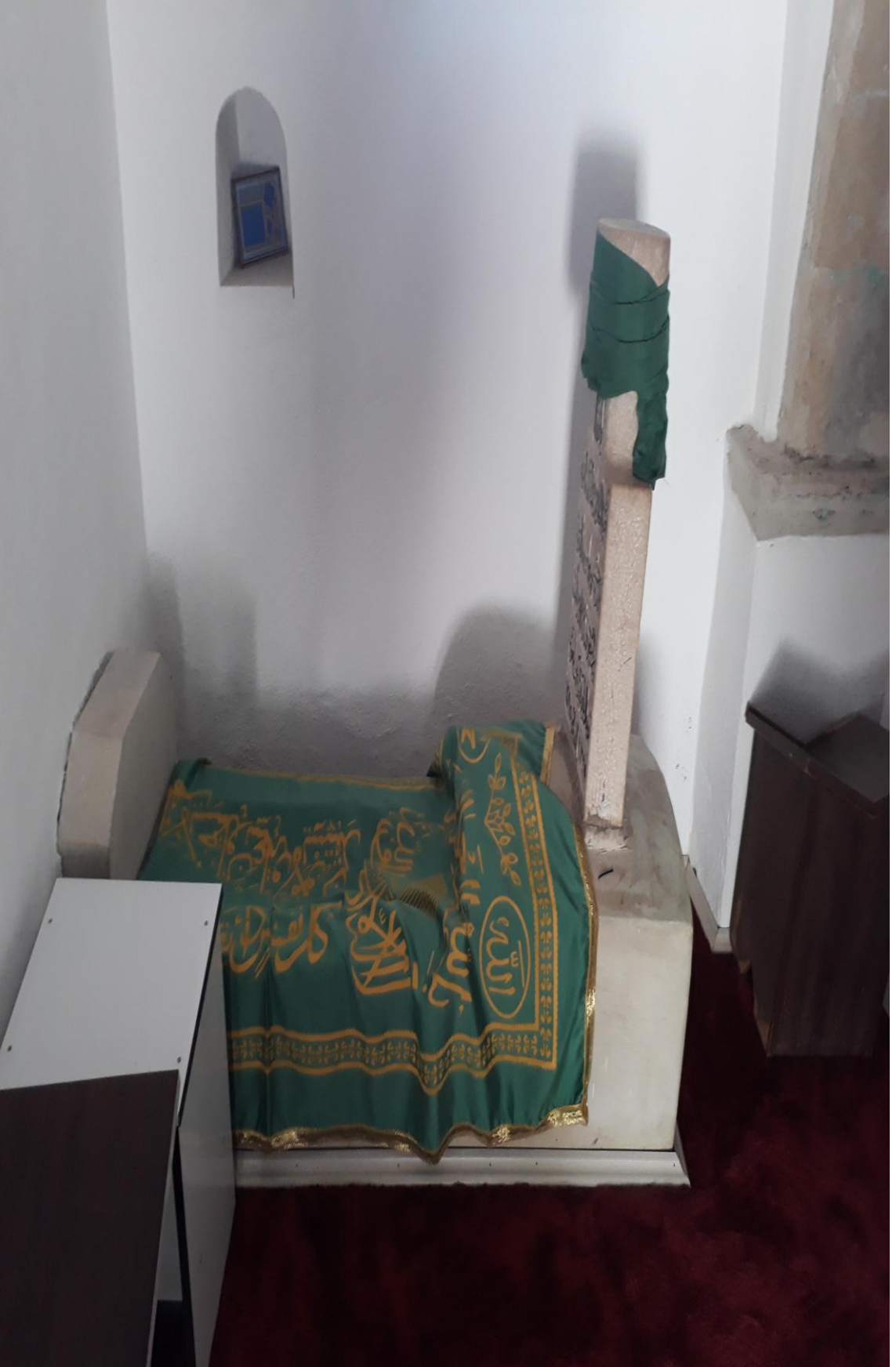
12- Osman Bedrüddin Erzurumi Türbesi ( Türbe içi Kabr-i Şerifleri Resim-5)