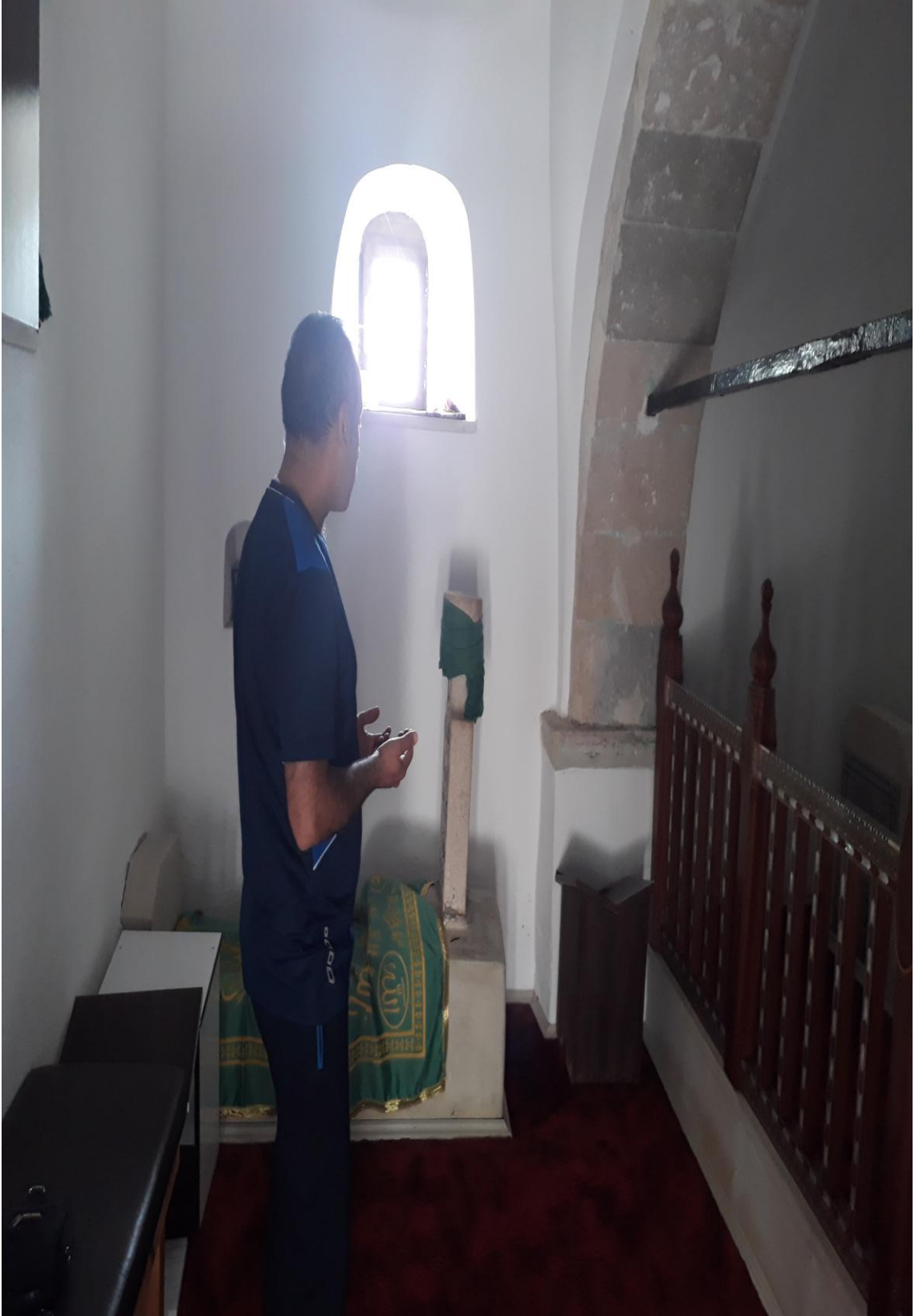
8- Osman Bedrüddin Erzurumi Türbesi ( Türbe içi Resim-2)