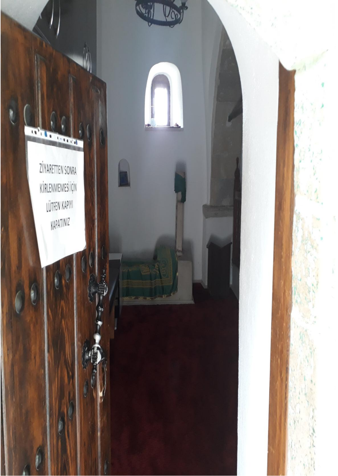
7- Osman Bedrüddin Erzurumi Türbesi ( Türbe içi Resim-1)