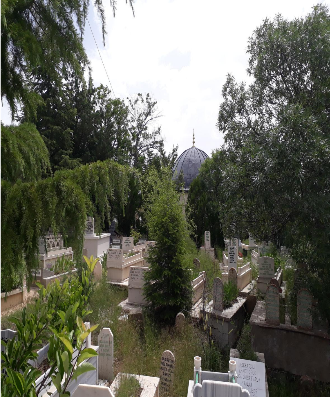
1- Osman Bedrüddin Erzurumî'nin Türbesinin Dıştan Görünümü

Bu başlık altında müellifimiz Osman Bedrüddin Erzurumî Efendi'nin Harput'ta bulunan türbelerini ziyaret ederek kabri-i Şeriflerinin birkaç fotoğrafını çektik. Aynı zamanda yıllarca kendisinden ders gören talebelerinin de fotoğraflarını da ekledik.