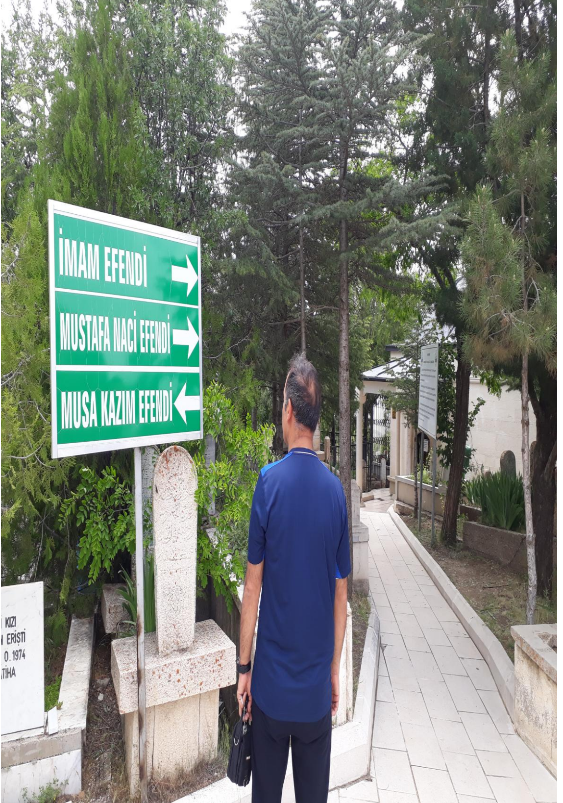
2- Osman Bedrüddin Erzurumunun Türbesinin bulunduğu yer.