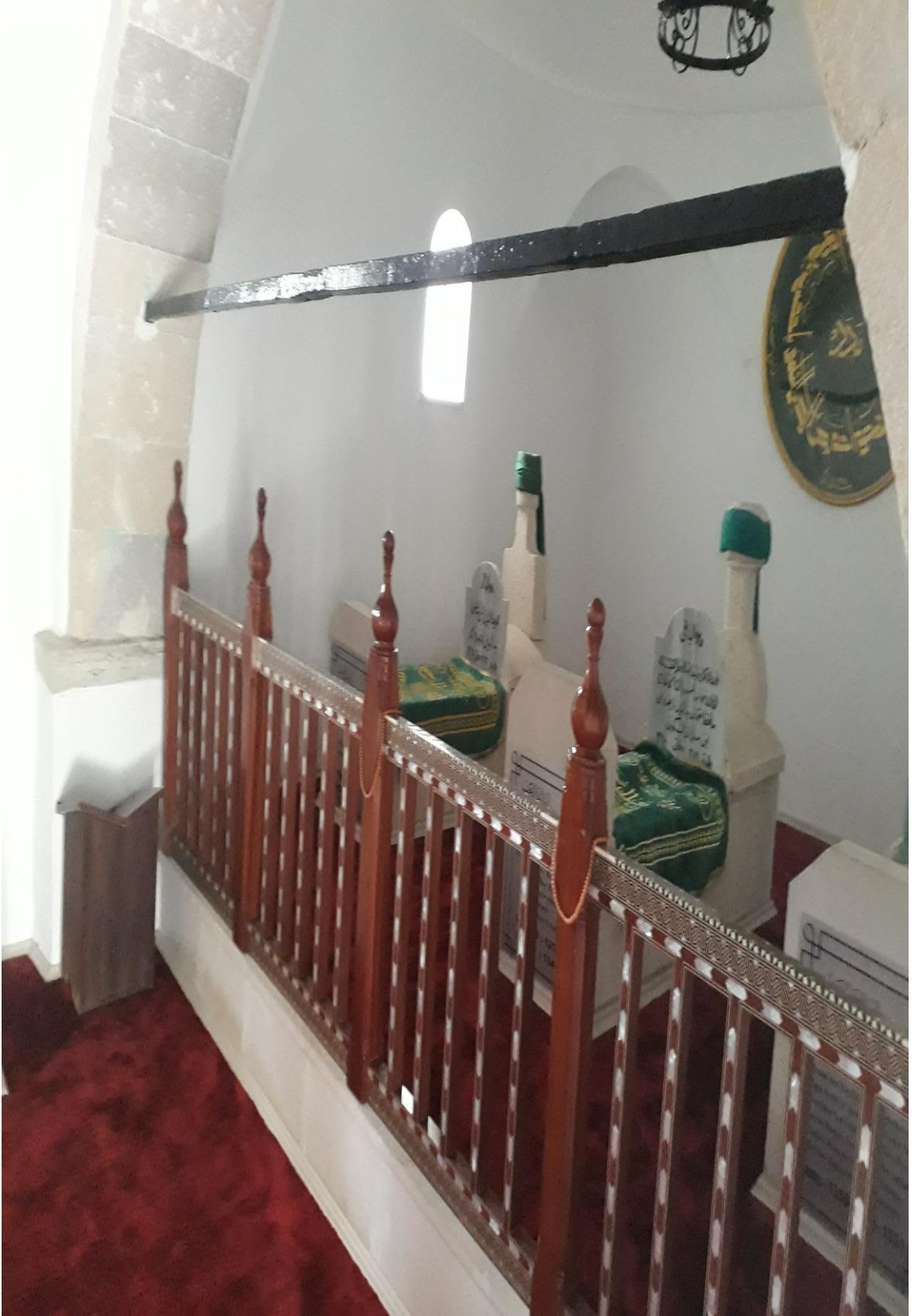
14- Osman Bedrüddin Erzurumi Türbesi ( Talebelerinin Kabr-i Şerifleri Resim-2)