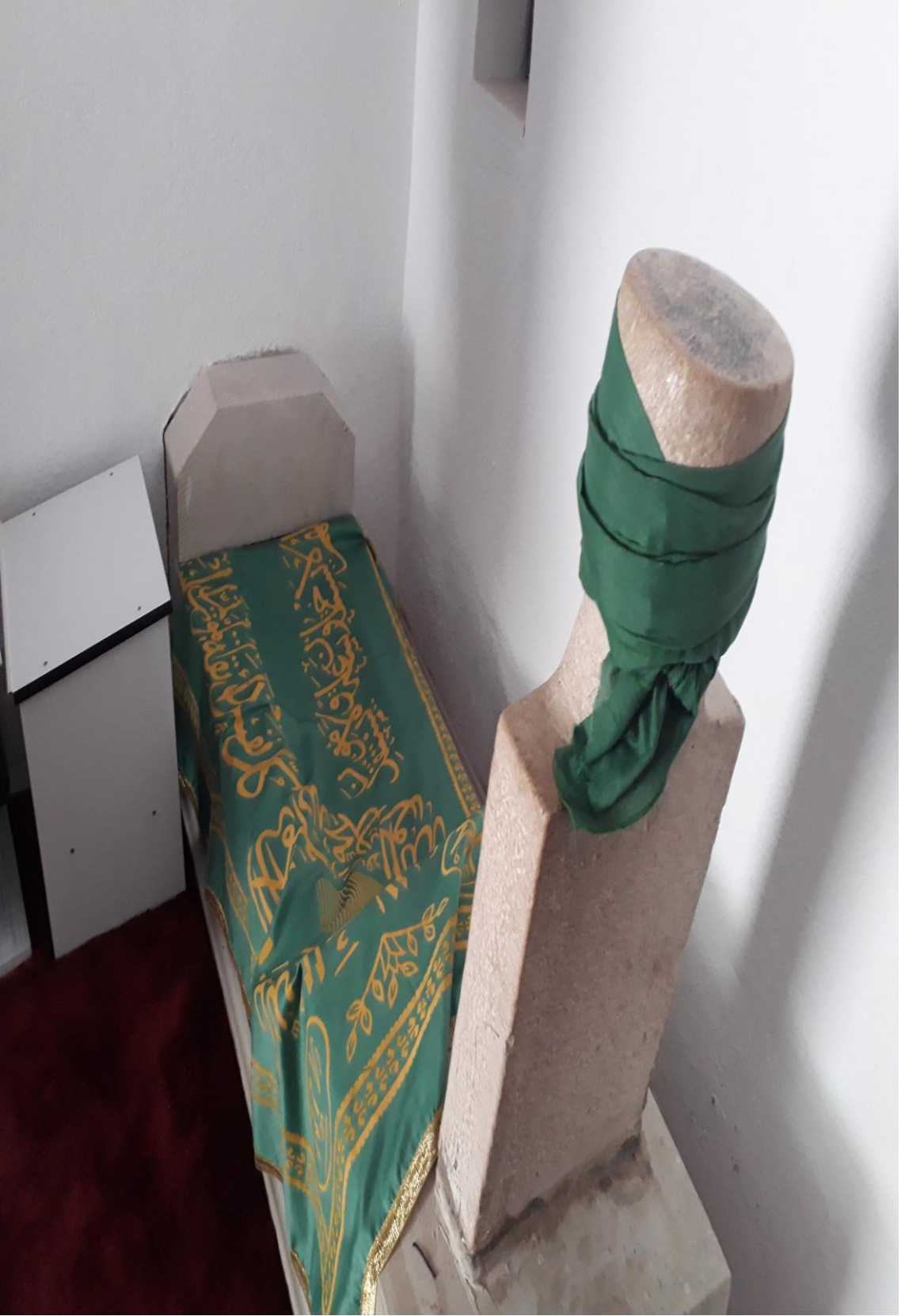
10- Osman Bedrüddin Erzurumi Türbesi ( Türbe içi Kabr-i Şerifleri Resim-4)