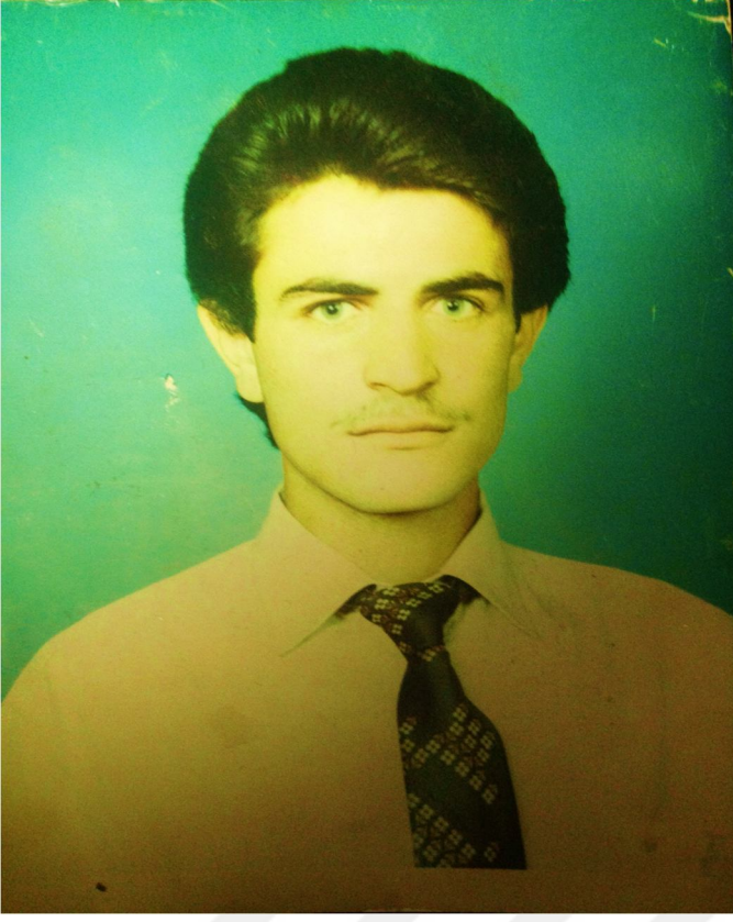
Resim 5: Kul Mansur'un gençlik yıllarından bir kare