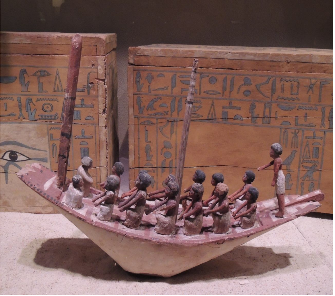
Eskiçağ'da Mısır'da bir gemi tasviri.