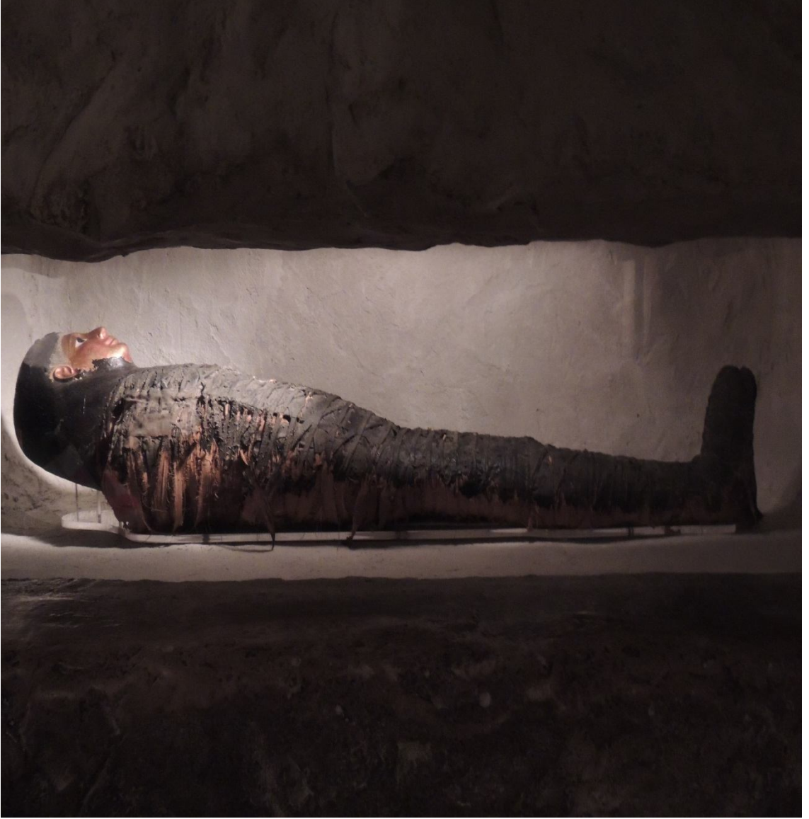
Mezar odasında mumyalanmış bir firavun.