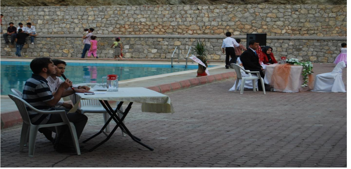
Kemaliye düğünlerinin yapıldığı yer havuz başı