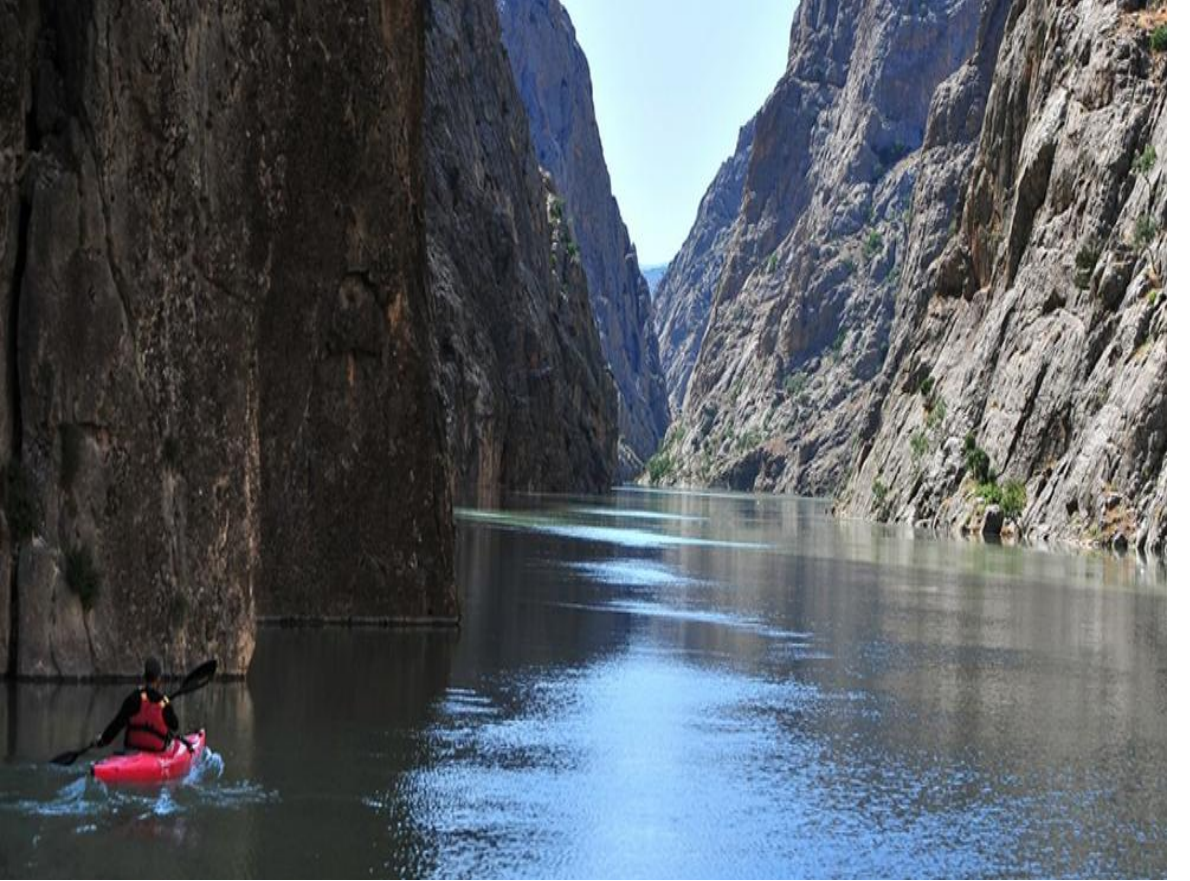
Kemaliye Karanlık kanyonun sudan görüntüsü