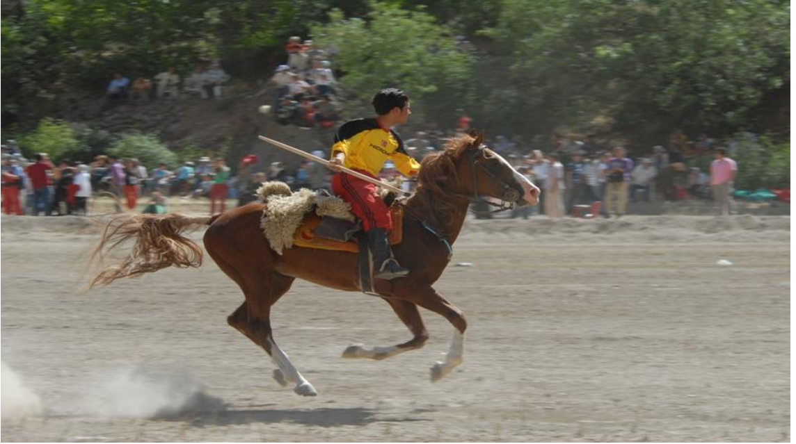
Doęa sporlarından görüntüler