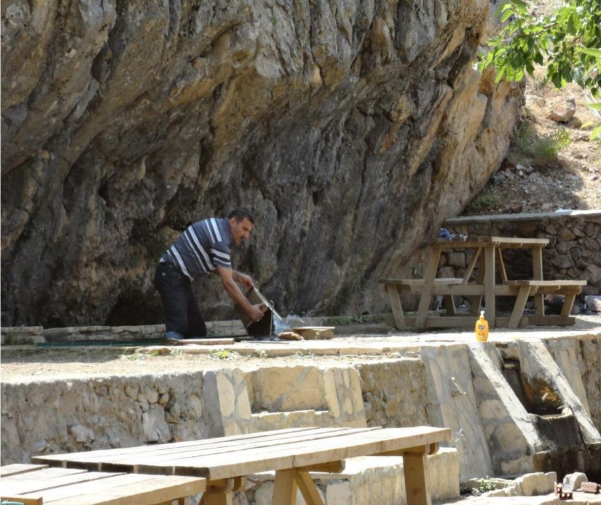
Kemaliye Kırk gözden bir resim