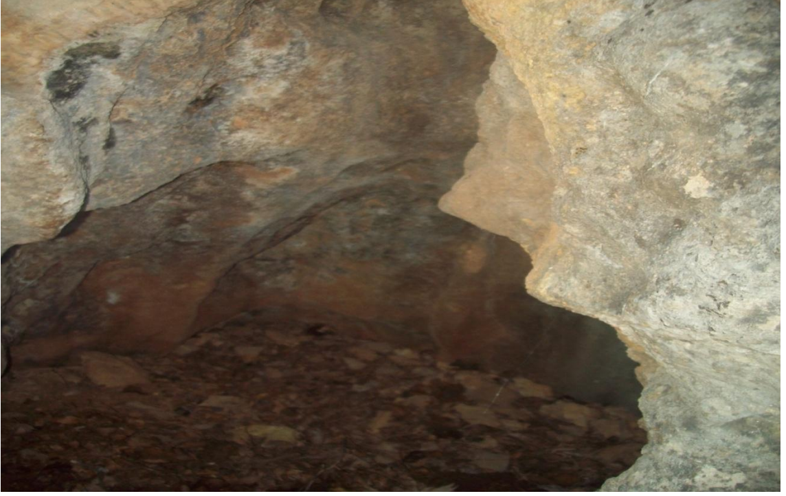
KUDRET CAMİSİ VE İÇİ