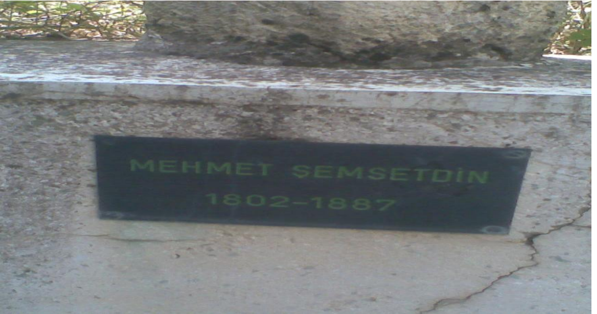
Geşo (Yeşilyamaç) Evliya Baba Türbesi