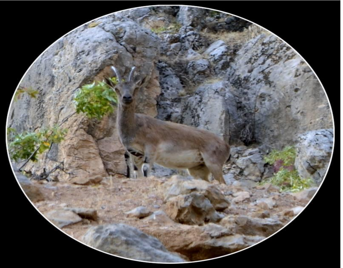
Kemaliye doğasından görüntüler