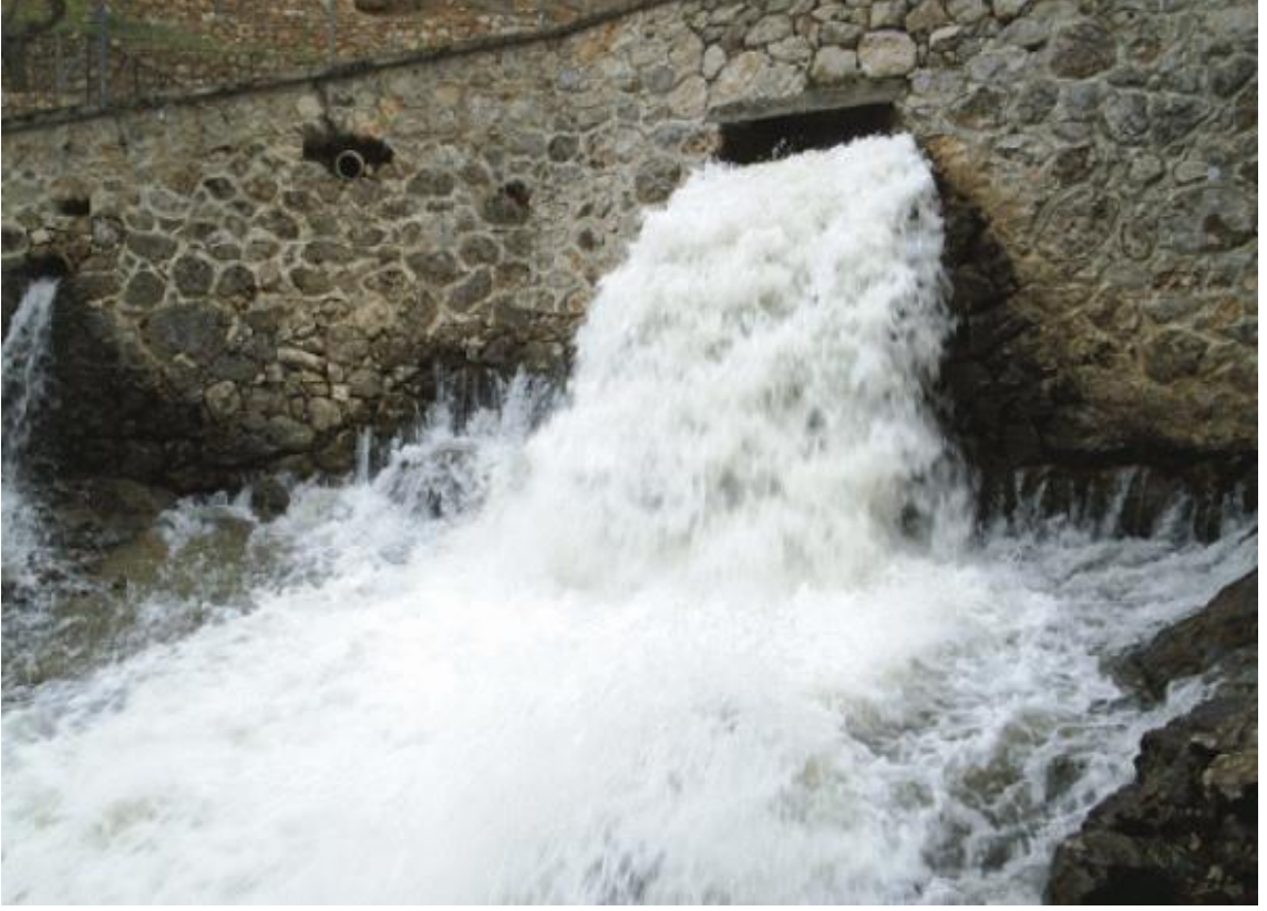
Kadı gölünün baharda coşkulu hali