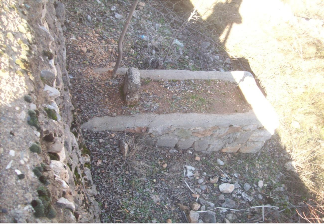
Peygamberimizin okçusu olduğu düşünölen Ebu Muhammed bin Ömer bin El Vakkas'ın mezarı