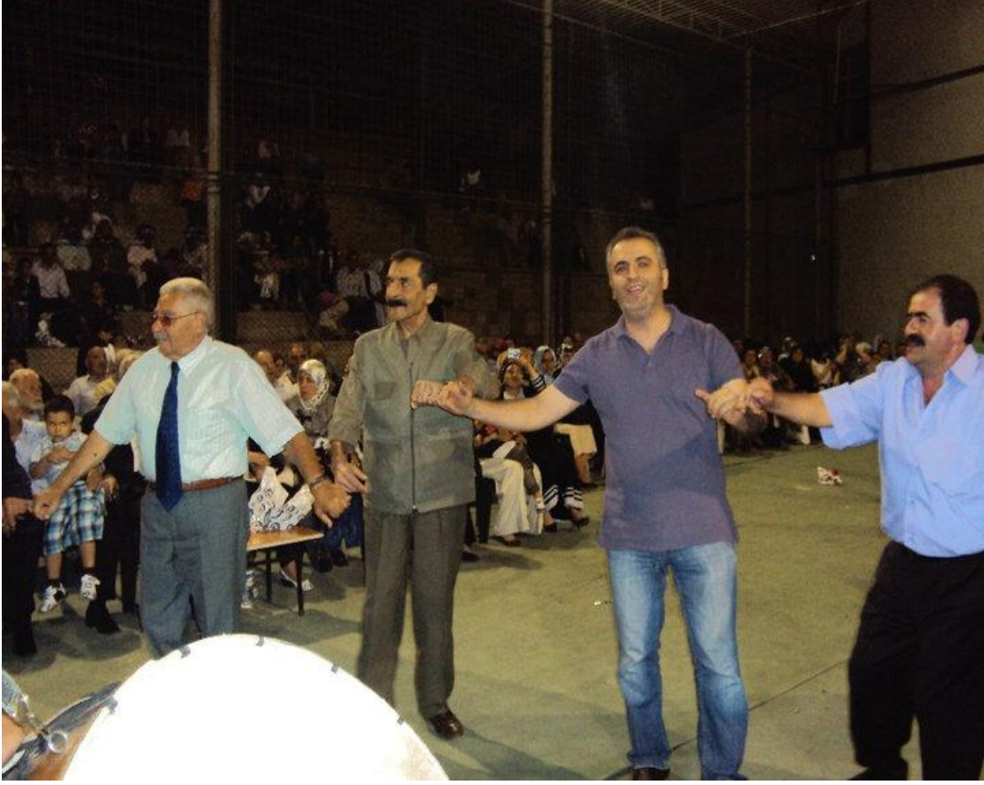
Kemaliye düğünlerinin yapıldığı yerler