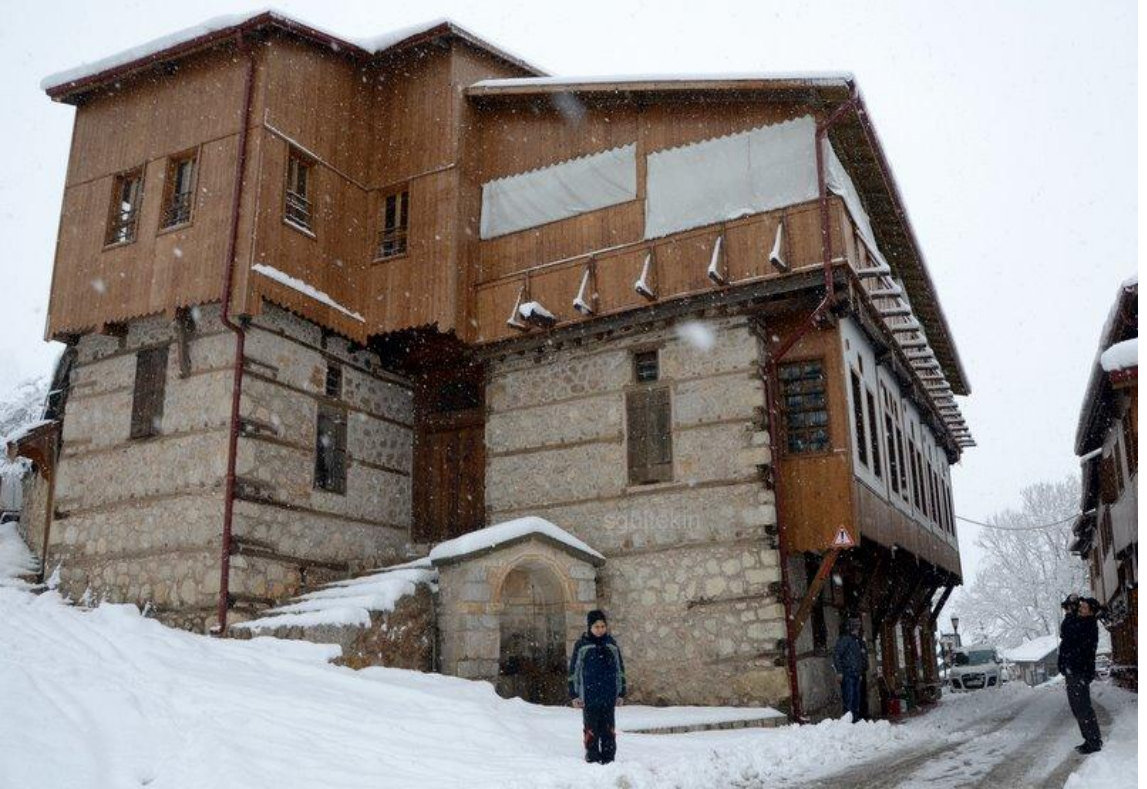
Kemaliye ilçesinde evlerin yapısında genelde kullanılan taş yapı.