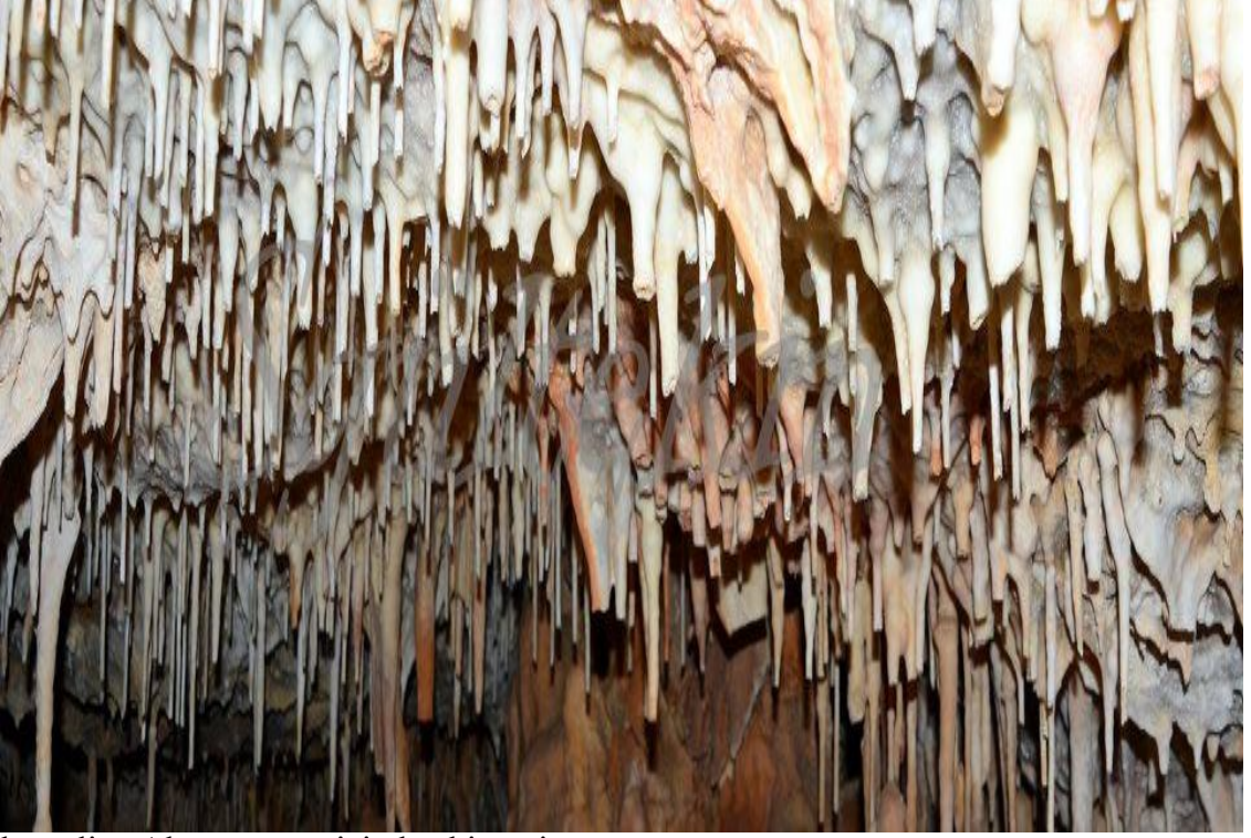
kemaliye Ala mağarası içinden bir resim