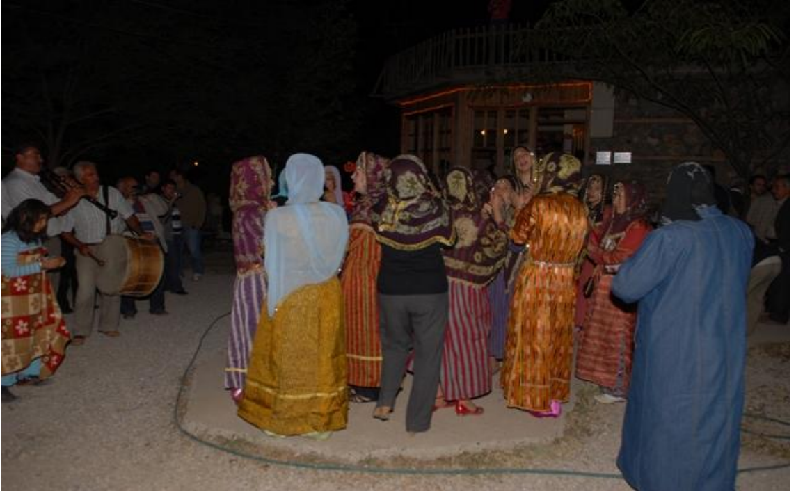
Kemaliye düğünlerinden bir kesit