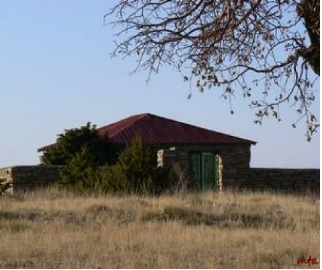
Başpınar Koçu Baba türbesi