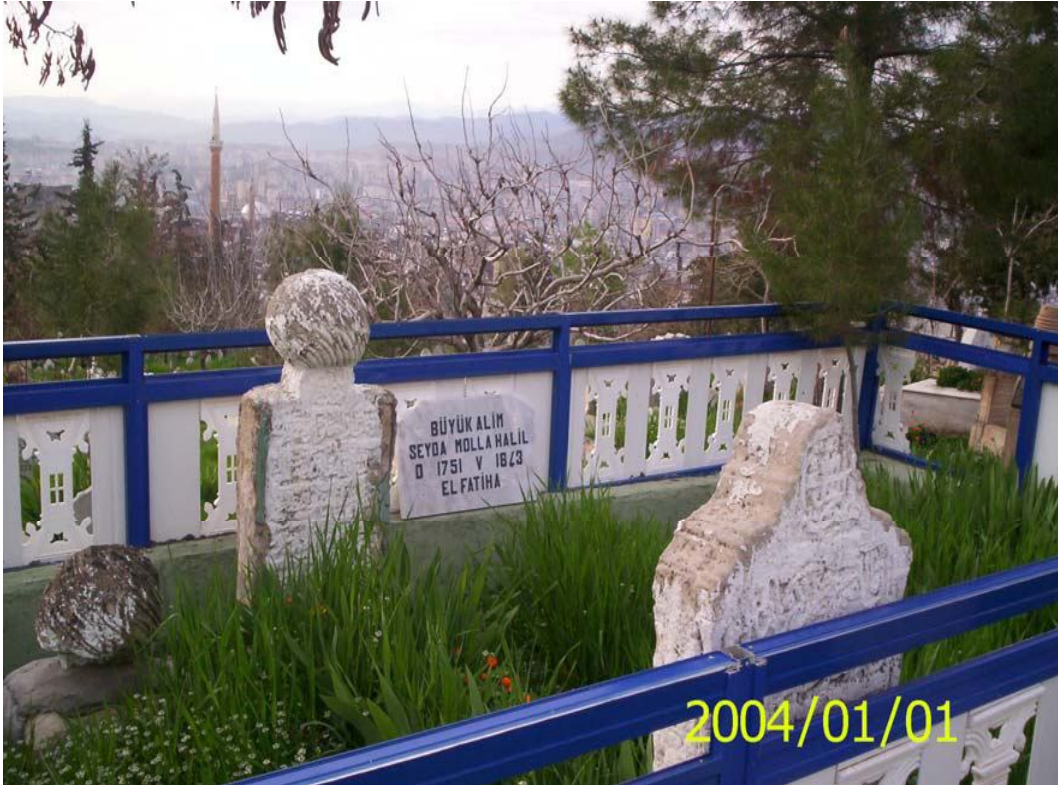
Ek-12 Molla Halil Es-Siird'i Türbesi