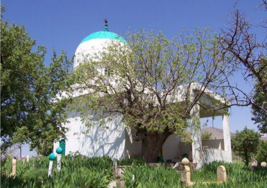
Ek-24 Şeyh Muhammed Tomani Türbesi