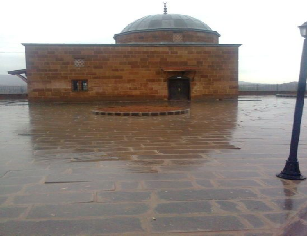
Ek-26 Şeyh Osman Türbesi