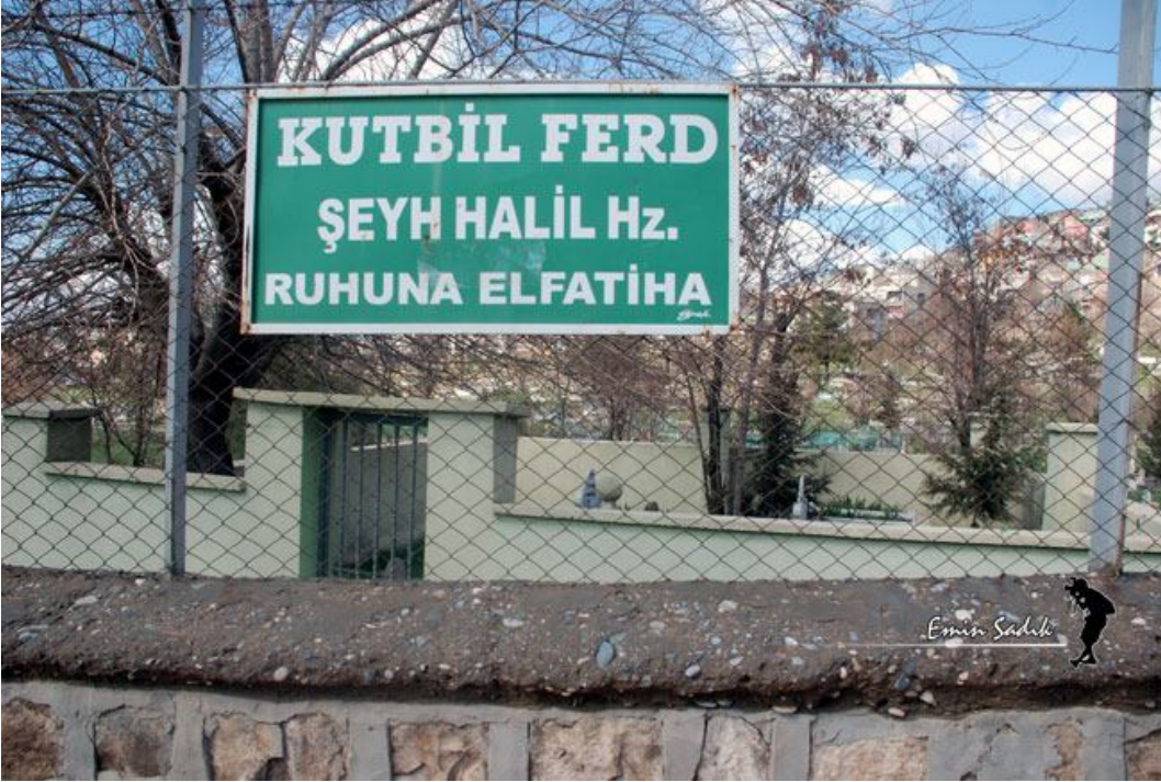
Ek-14 Şeyh Halil-ül Ferd Hazretleri Türbesi