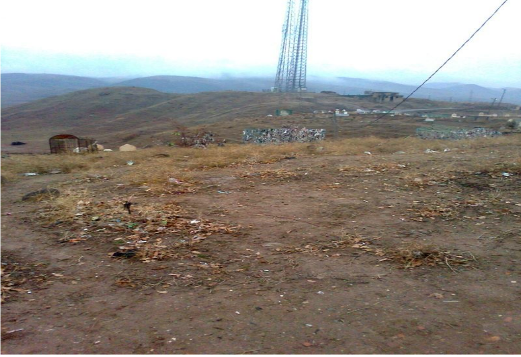
Ek-27 Şeyh Osman Türbesinde Şeytan Taşlama ve Çaput Bağlama Yeri