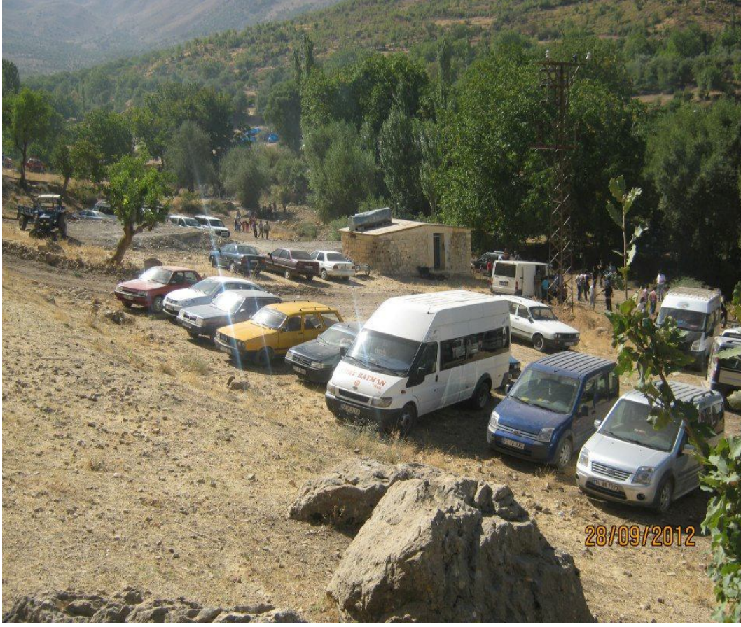
Ek-31 Bapire Sofi Türbesi Ve Etkinlikleri