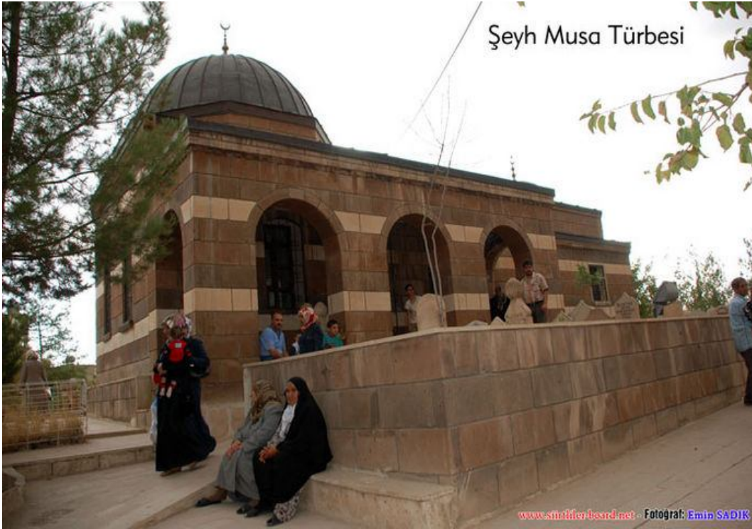
Ek-10 Şeyh Musa Türbesi