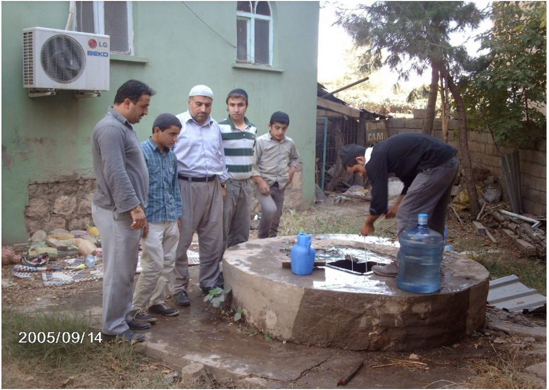
Ek-6 Şeyh Muhammed Tarmili Şifalı Su Kuyusu