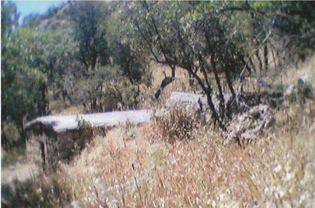
Ek-30 Şeyh Abdurrahman Eş-Şavırı Türbesi