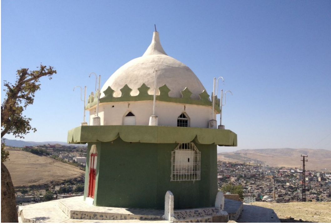
Ek-9 Şeyh-üt Türkî Türbesi