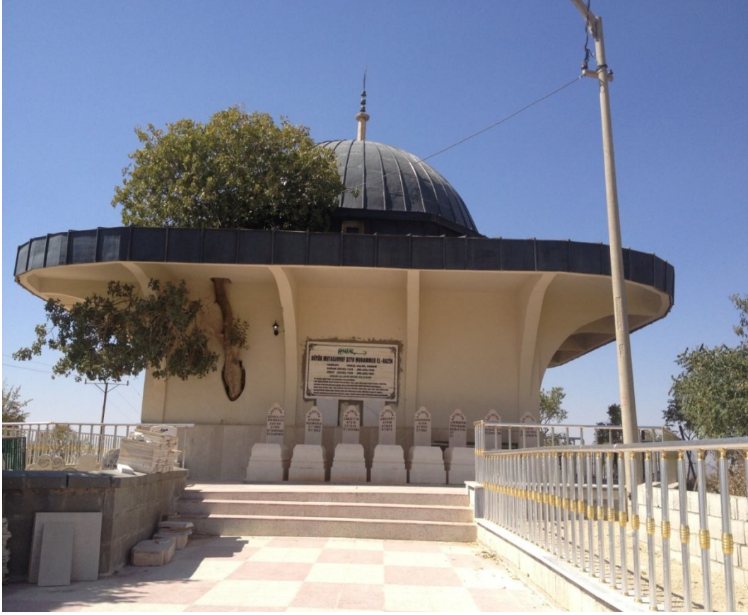
Ek-21 Şeyh Muhammed Hazin Türbesi