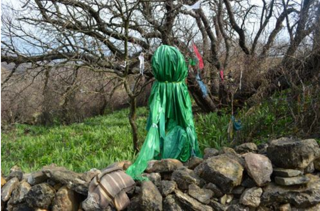
Ek-32 Şeyh Muhammed Bin Hanife Türbesi