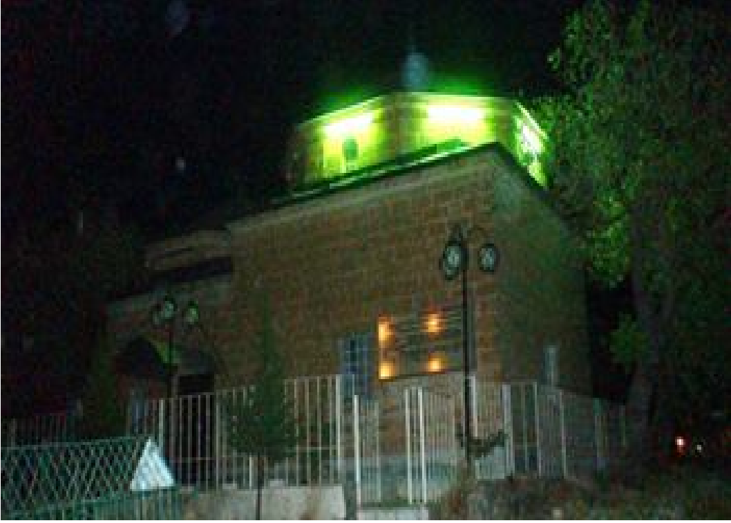
Ek- 23 Şeyh Mücahit Türbesi