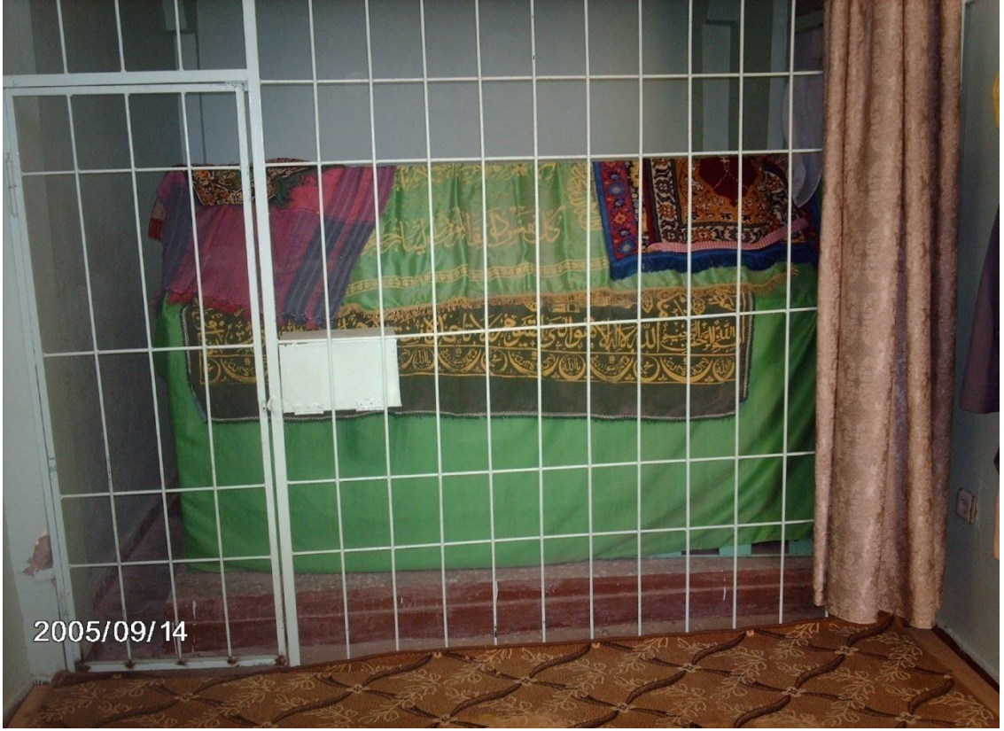
Ek- 5 Şeyh Muhammed Tarmili Türbesi