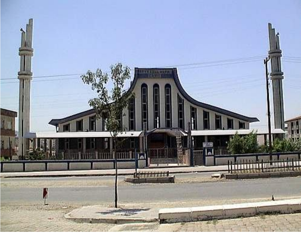
Ek-3 Şeyh Ebü'l Vefa Camii ve Türbesi