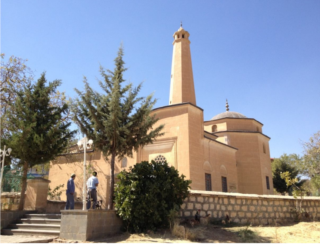
Ek-17 İsmail Fakirullah ve İbrahim Hakkı Hazretleri Türbeleri