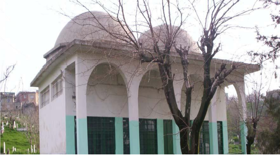
Ek-13 Şeyh Süleyman Türbesi