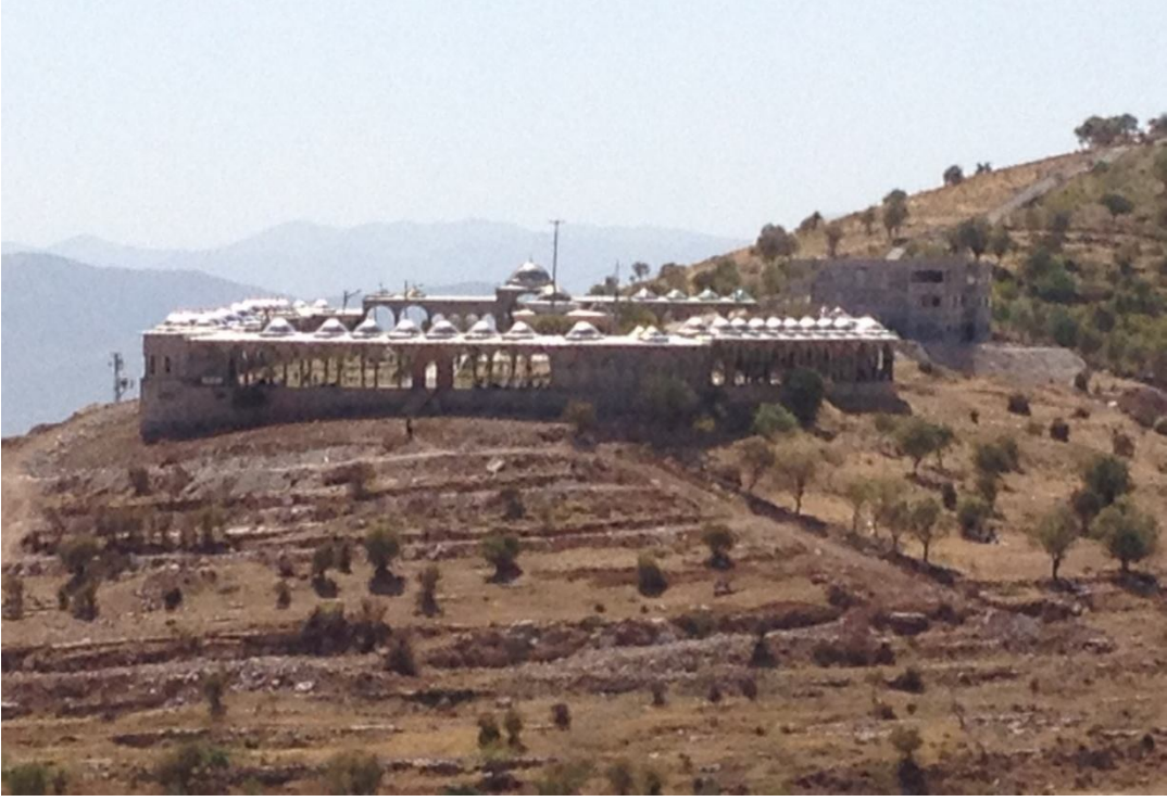
Ek-19 Kubbe-i Hasiye