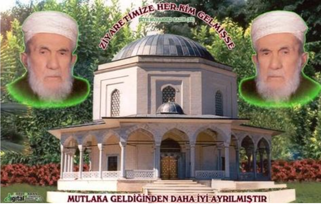
Ek-16 Şeyh Muhammed Kazım'ın İşyerlerinde Asılı Fotoğrafi