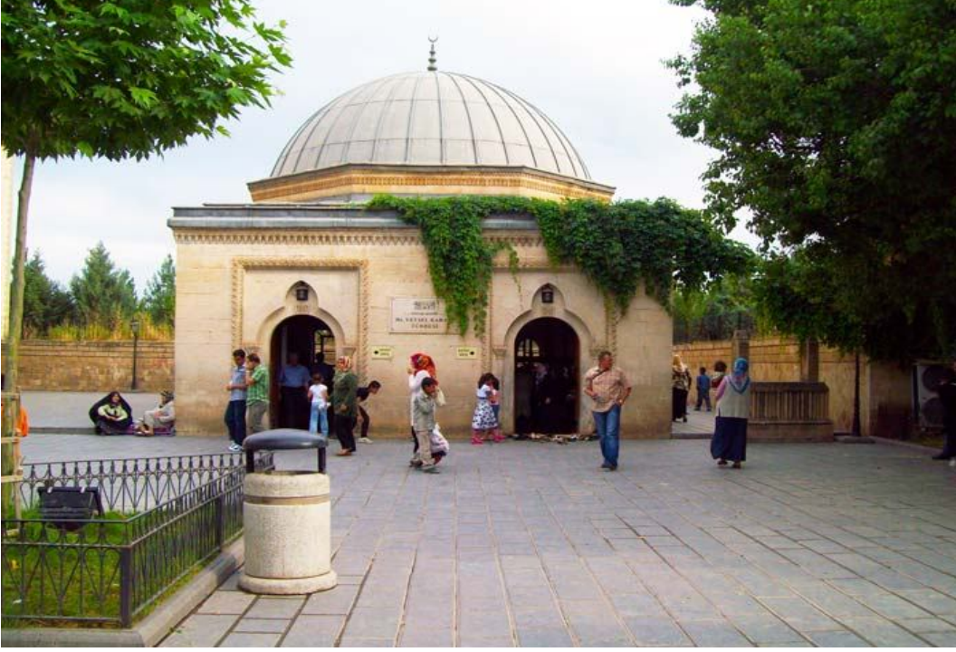
Ek- 25 Uveys el-Karanî Türbesi