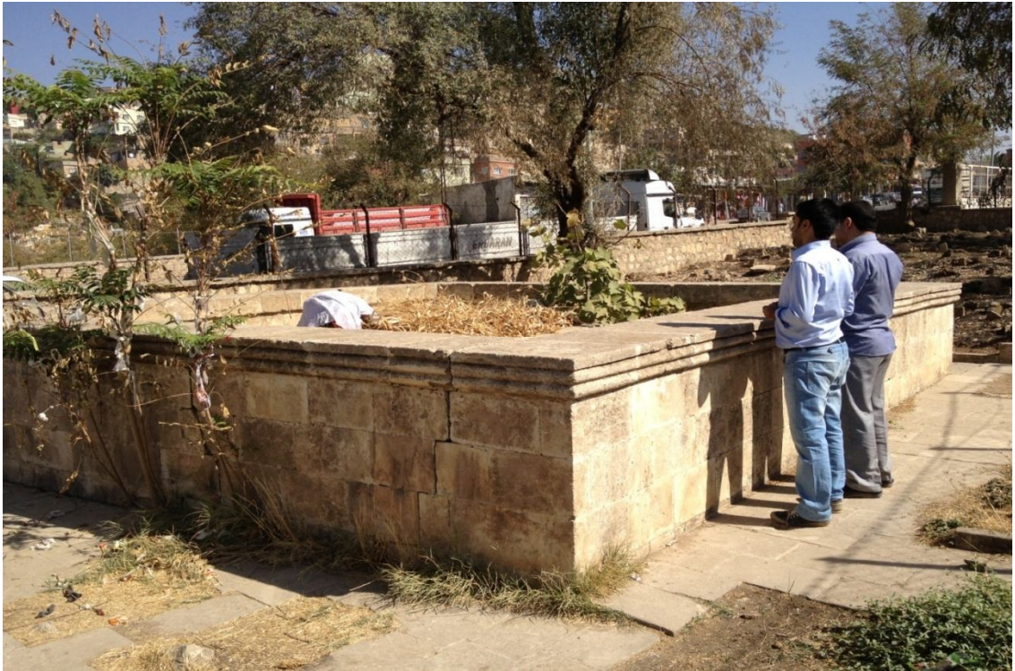
Ek-8 Şeyhetü'z-Zeynep Türbesi