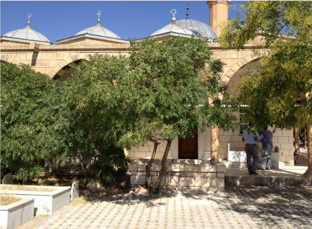
Ek-18 Sultan Memduh ve Zemzem'ül Hassa Türbeleri