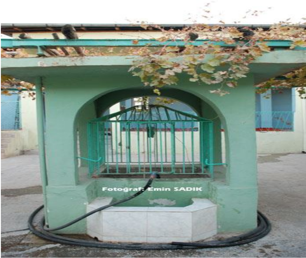
Ek-7 Muhammed bin Münkedir Türbesi ve Şifalı Su Kuyusu