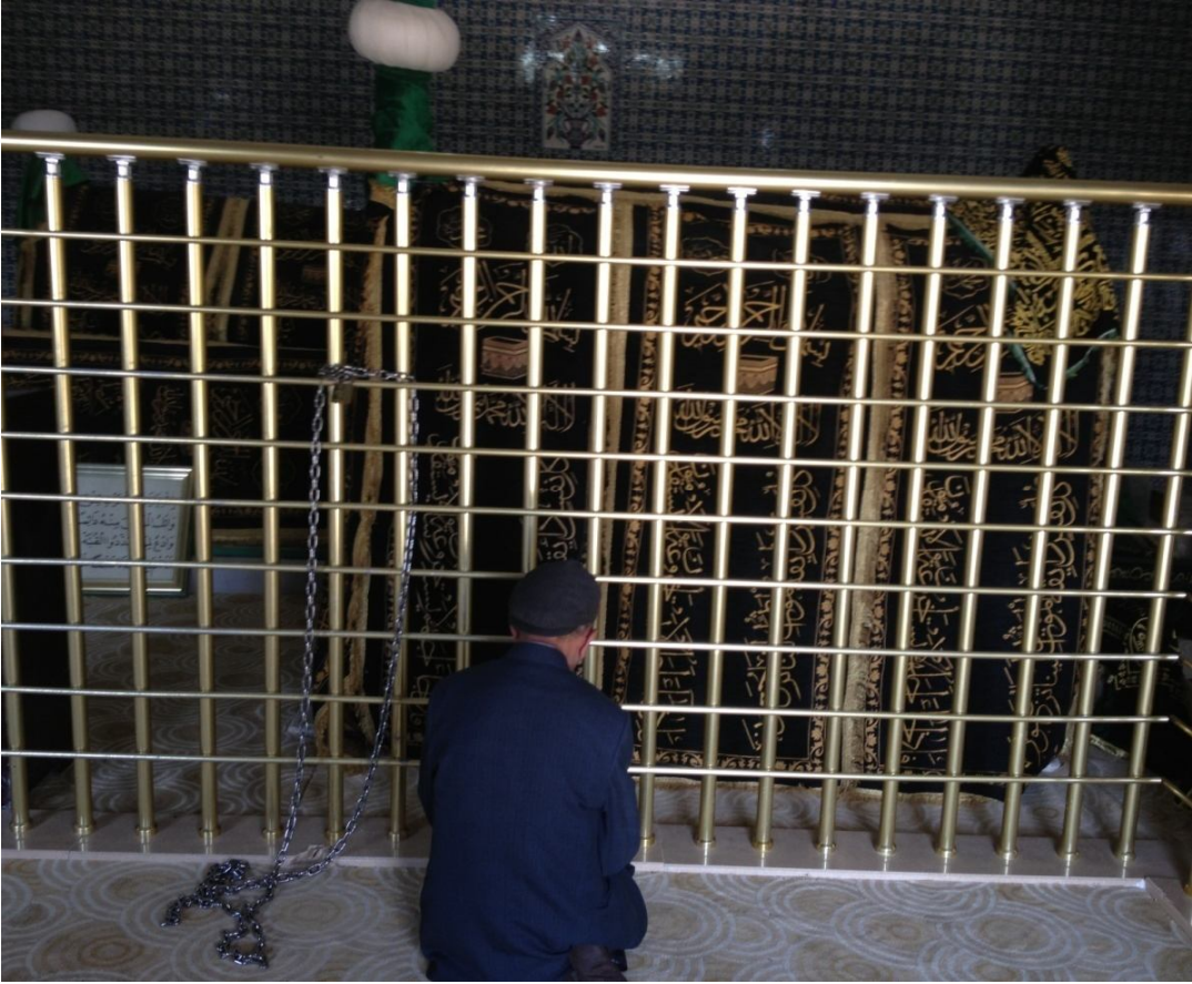
Ek-20 Şeyh Muhammed Hazin Kabri ve Türbe İçerisinde Bulunan Zincir