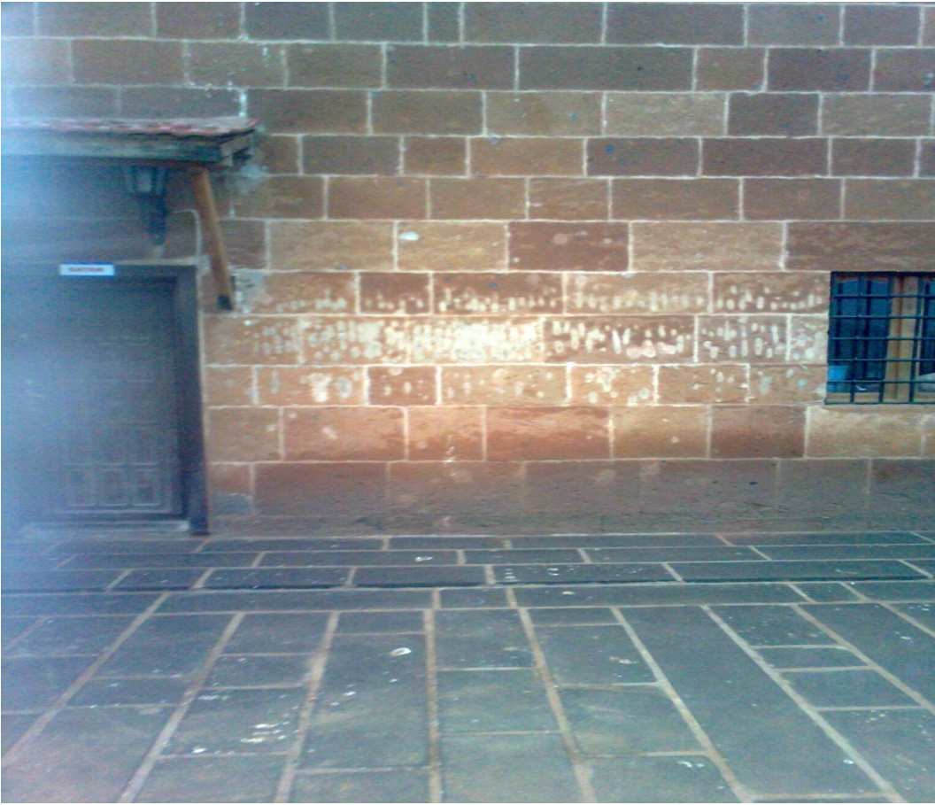
Ek-28 Şeyh Osman Türbesinde Taş Yapıştırma Alanı