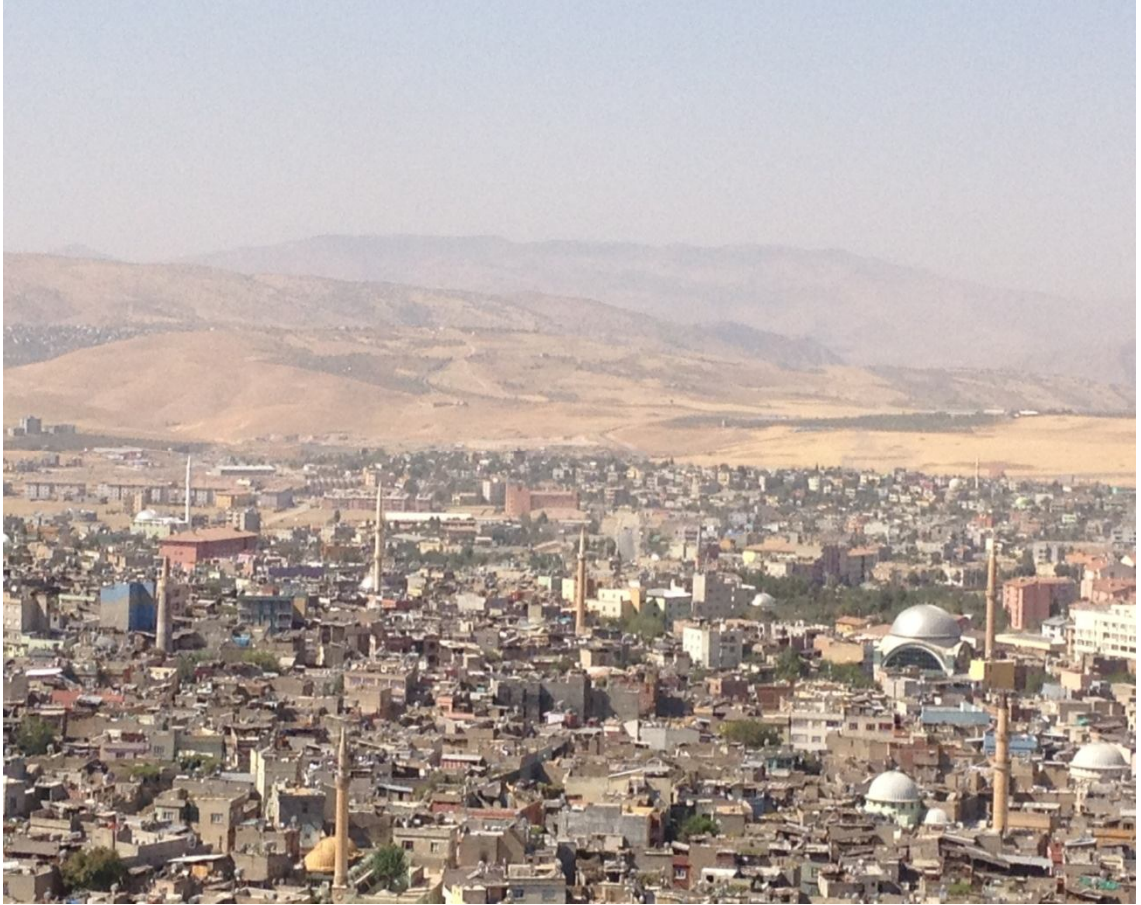
Ek-2 Siirt'ten Görünüş