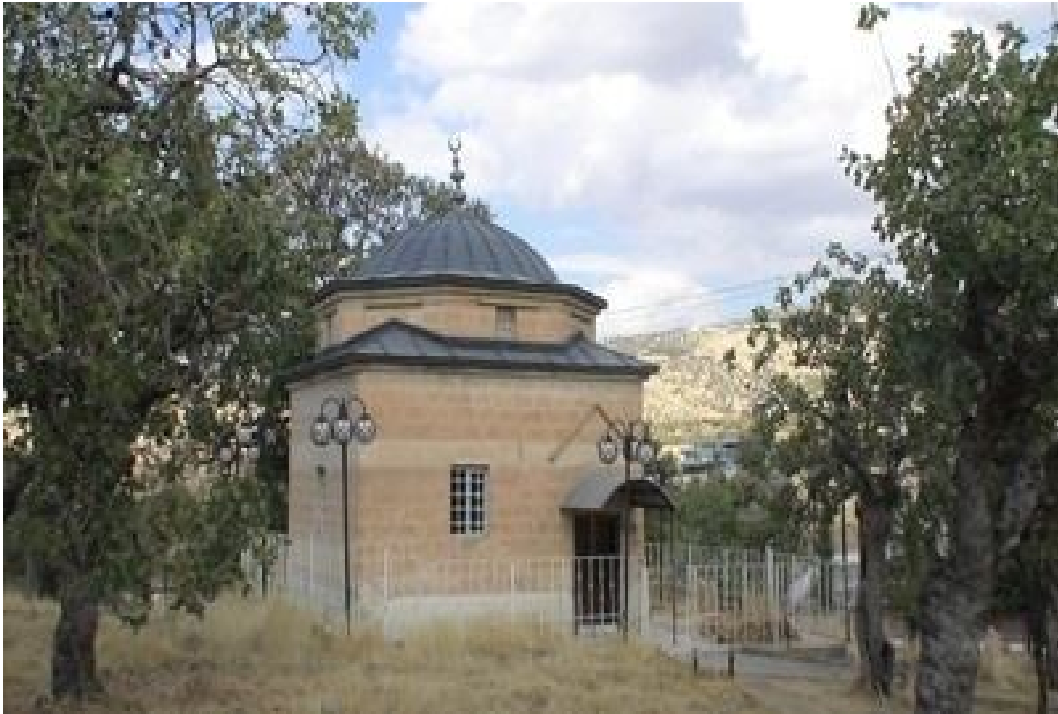
Ek-22 Şeyh Hamza El-Kebir Türbesi