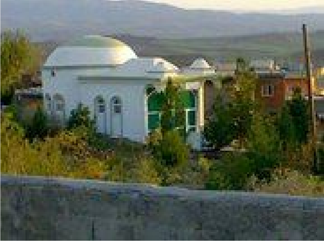
Ek-35 Seyyid Hasan Türbesi