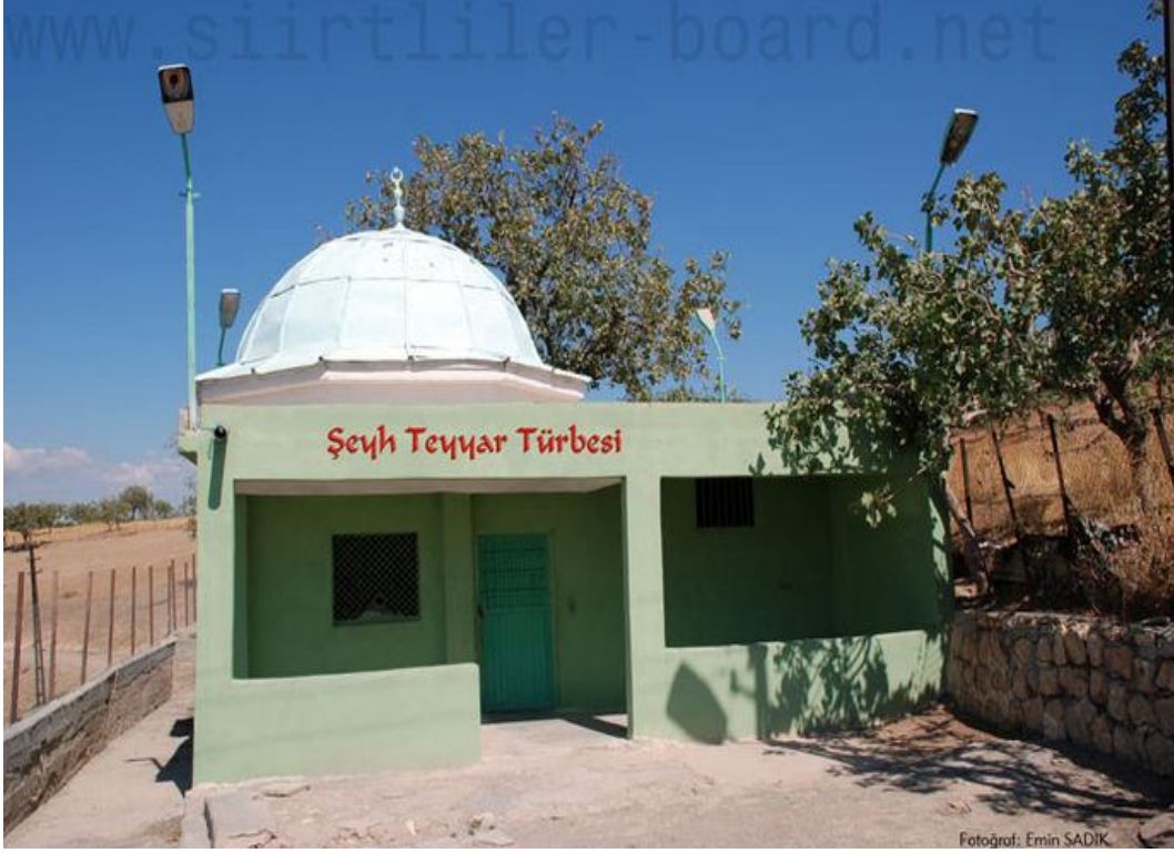
Ek-11 Şeyh Tayyar Türbesi