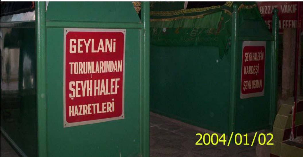
Ek-4 Şeyh Halef Türbesi