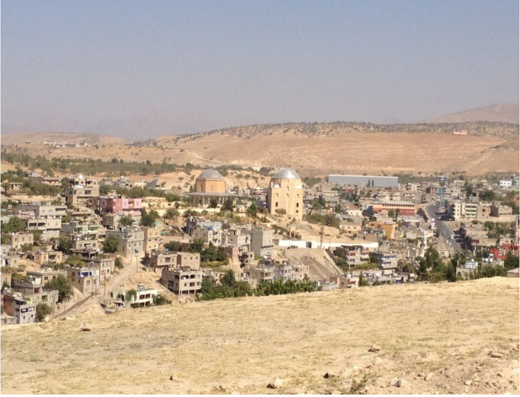
Ek-15 Şeyh Muhammed Kazım Türbesi