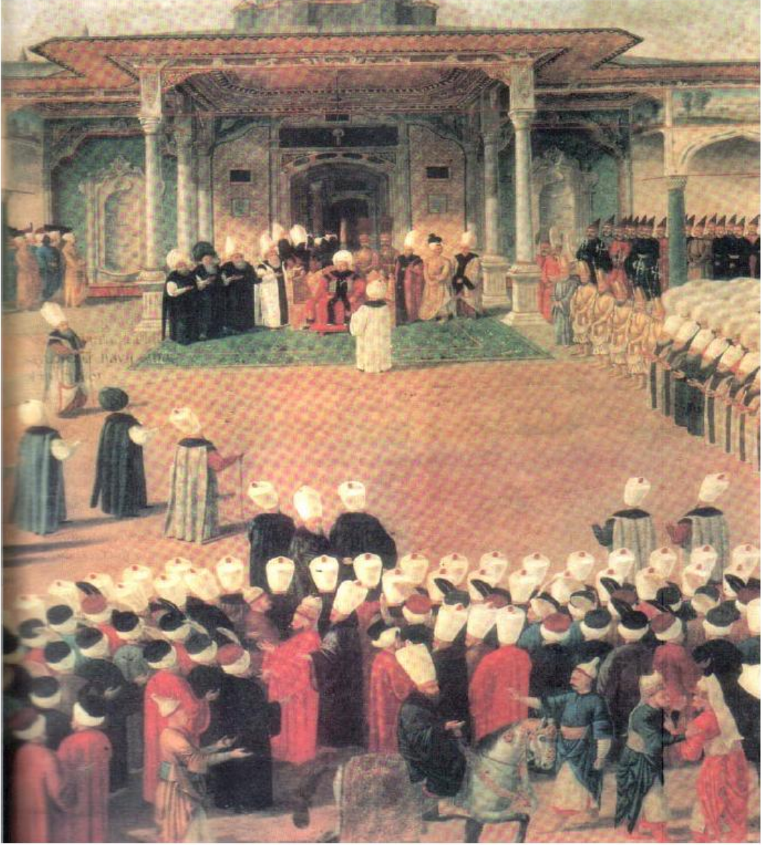
EK-41:III. Selim, Topkapı Sarayı'nda Düzenlenen Bir Bayramlaşma Töreninde