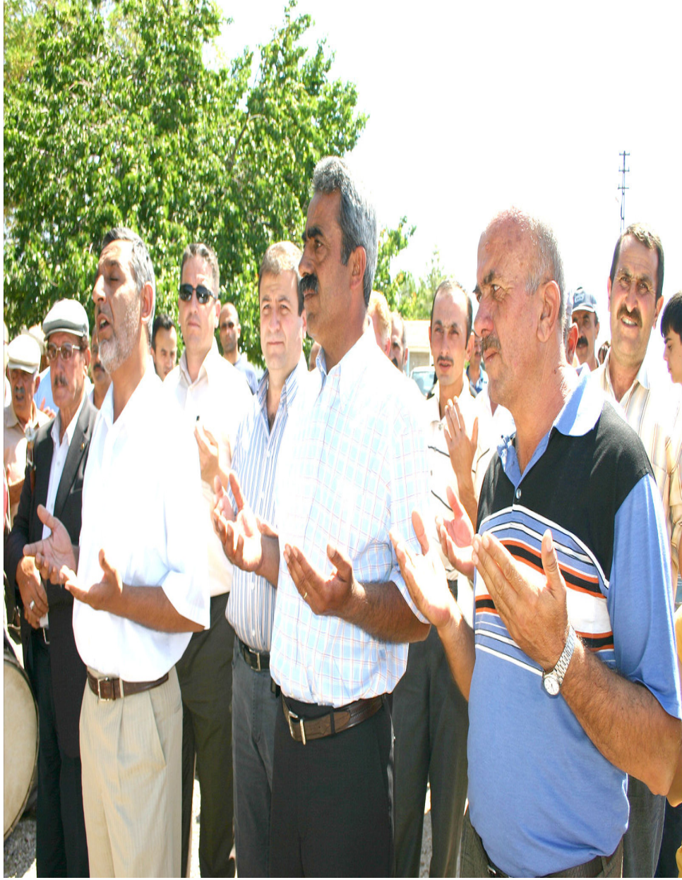
Ek-11. Gelin çıkarma