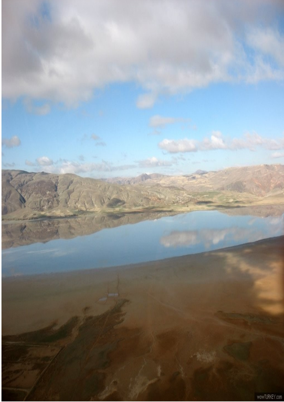
Ek-6. Tuz Gölü