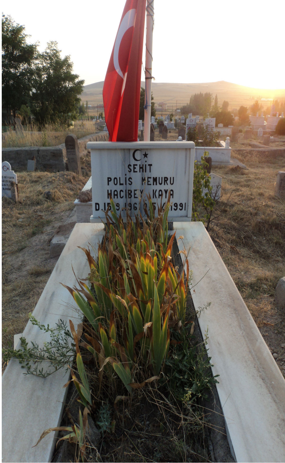
Ek-16. Sarıođlan İlçe Mezarlıđı