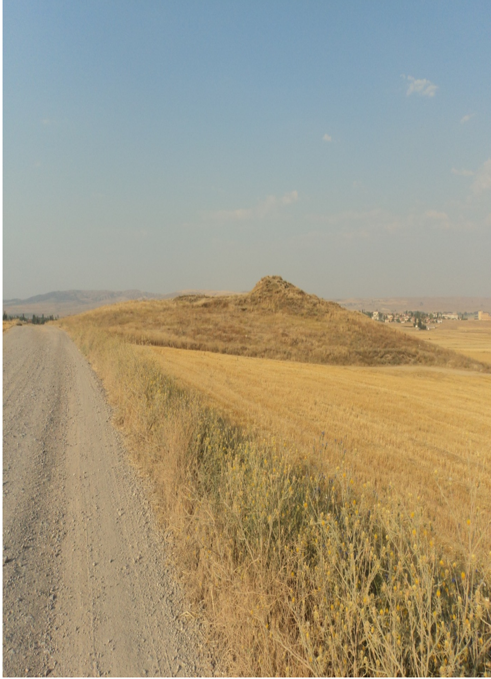
Ek-17. Uzankaya Tepesine giden yol