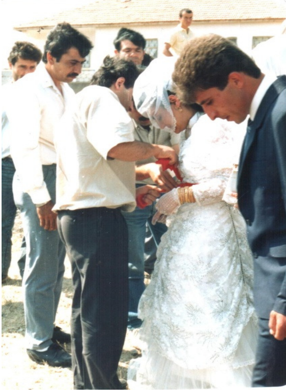
Ek-12. Geline Kuşak Bağlama