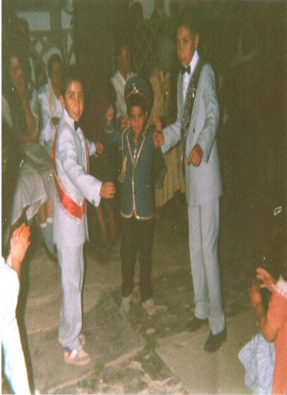
Ek-8. Sünnet Kınası