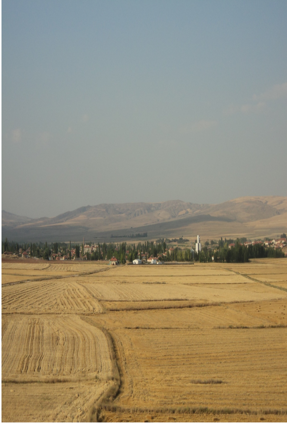
Ek-3. Sarıođlan Ovası