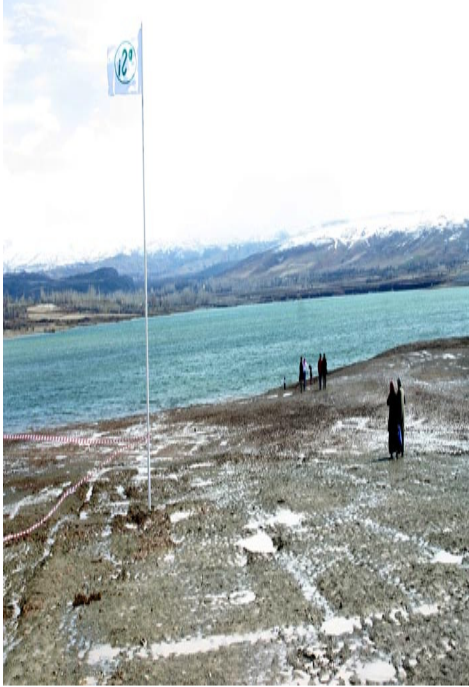
Ek-5. Sarıođlan Barajı