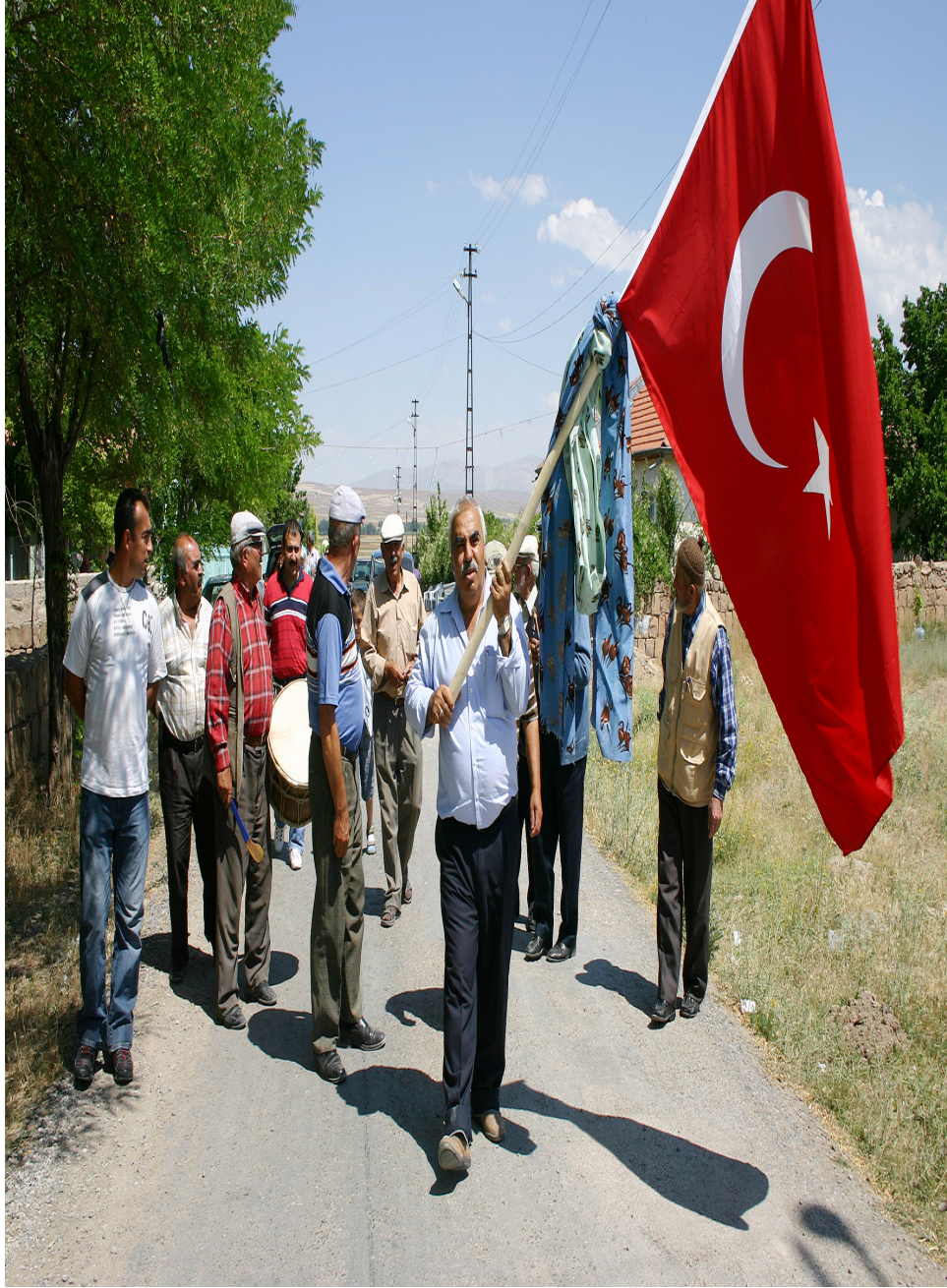
Ek-9. Bayrak getirme