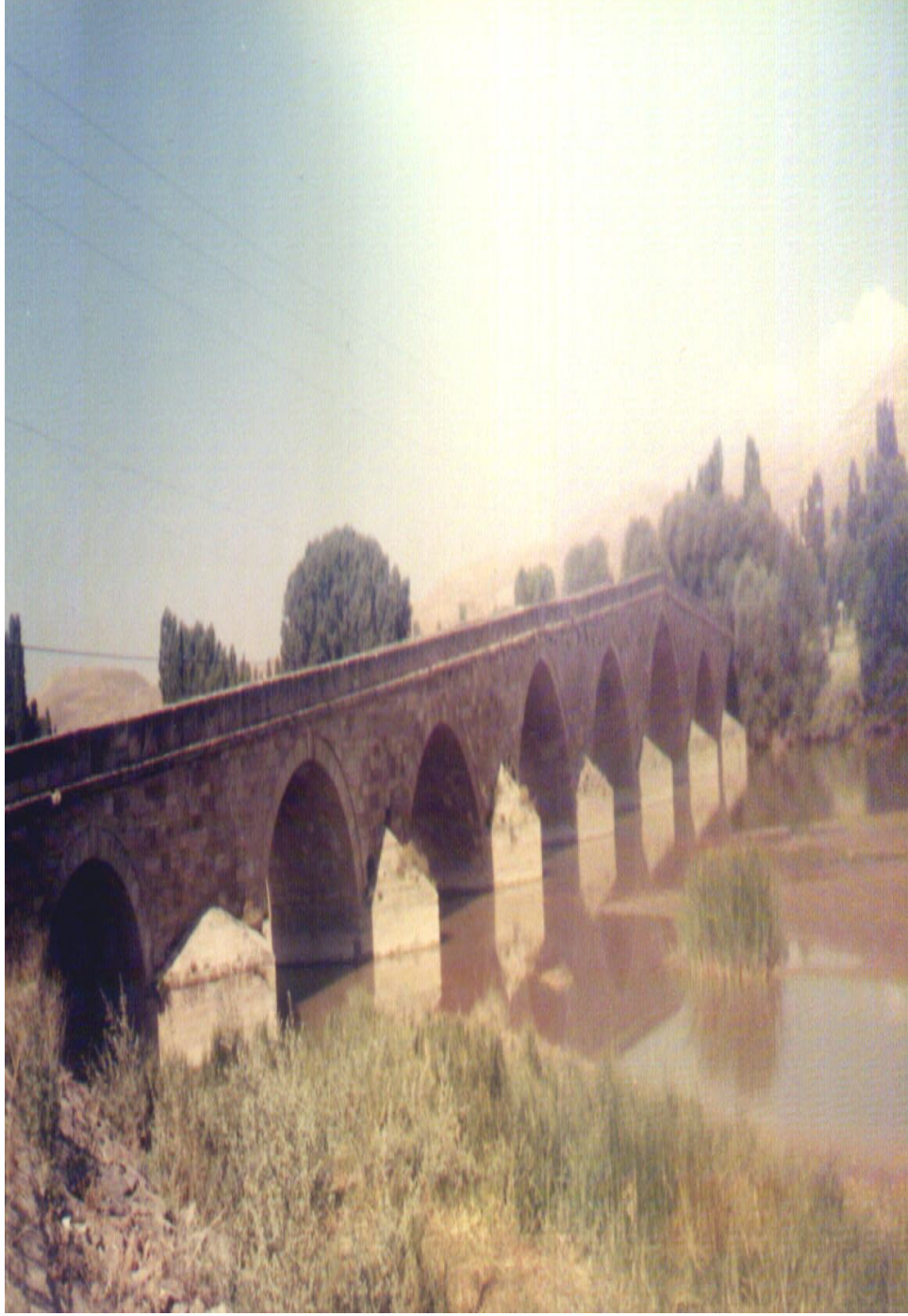
Ek-7. Şahruh Köprüsü