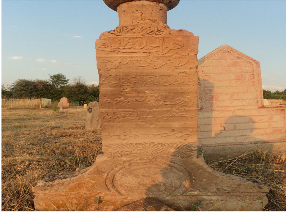
Ek-15. Sarıođlan İlçe Mezarlığı