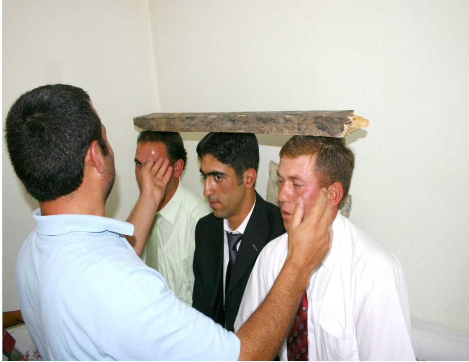
Ek-14. Güvey evi