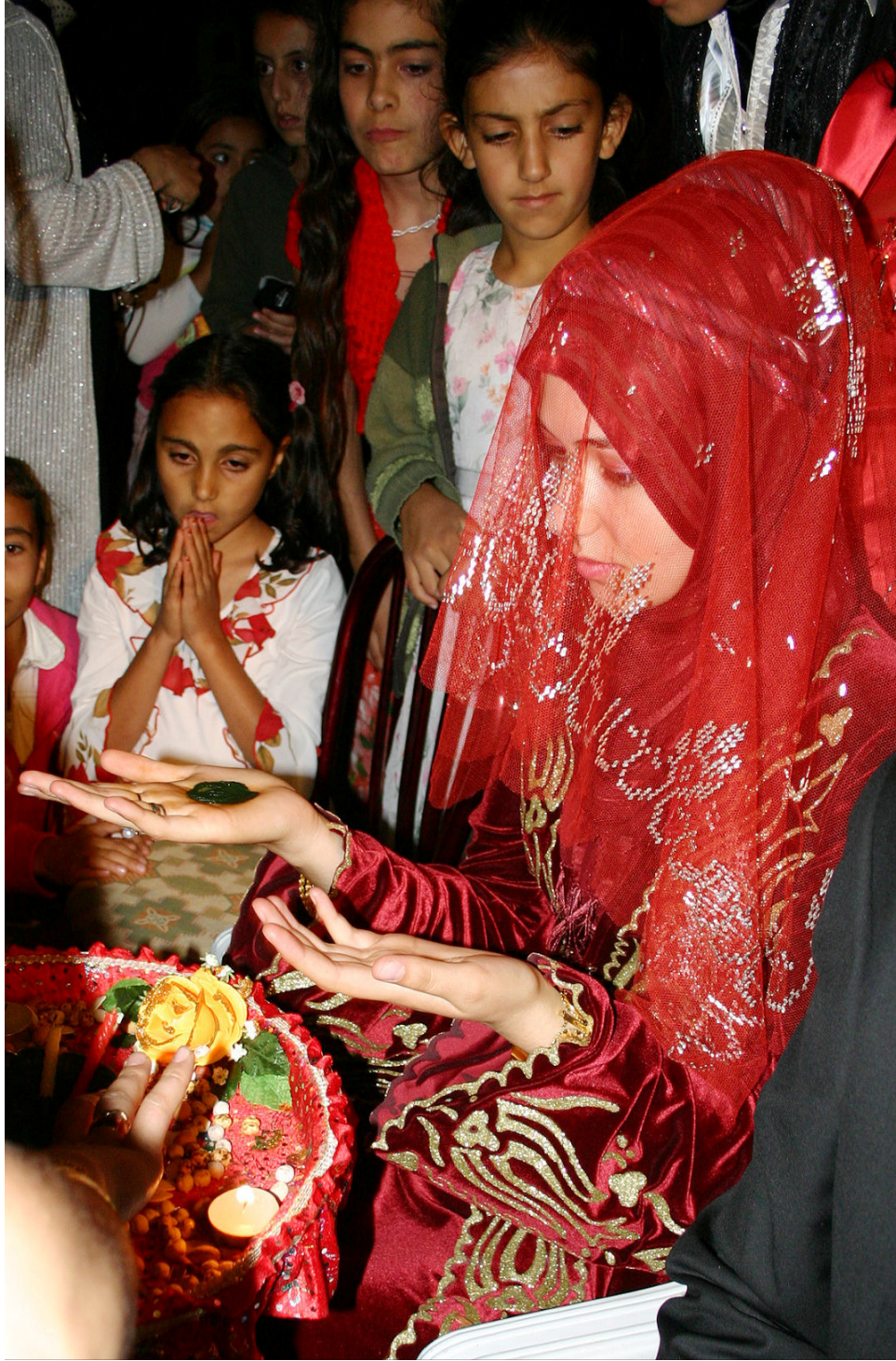
Ek-10. Kına yakılan gelin