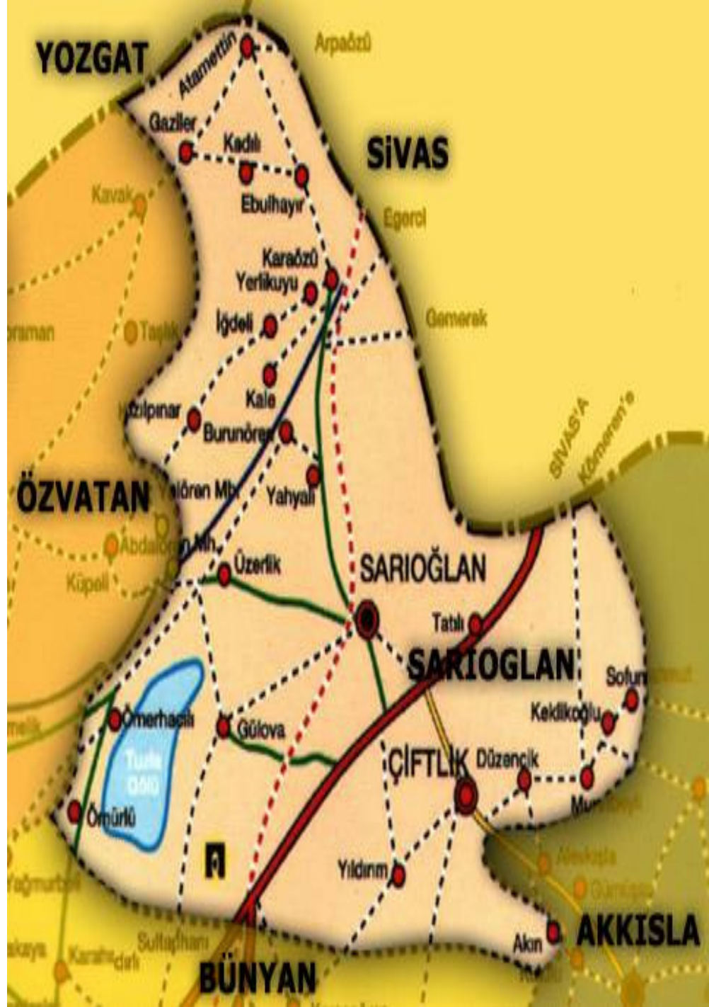
Ek-1. Sarıođlan Haritası