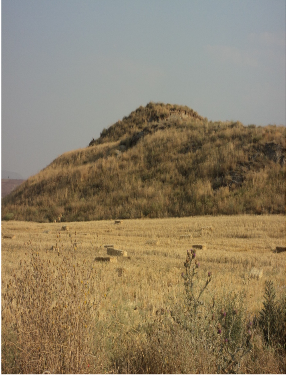
Ek-18. Uzankaya Tepesi