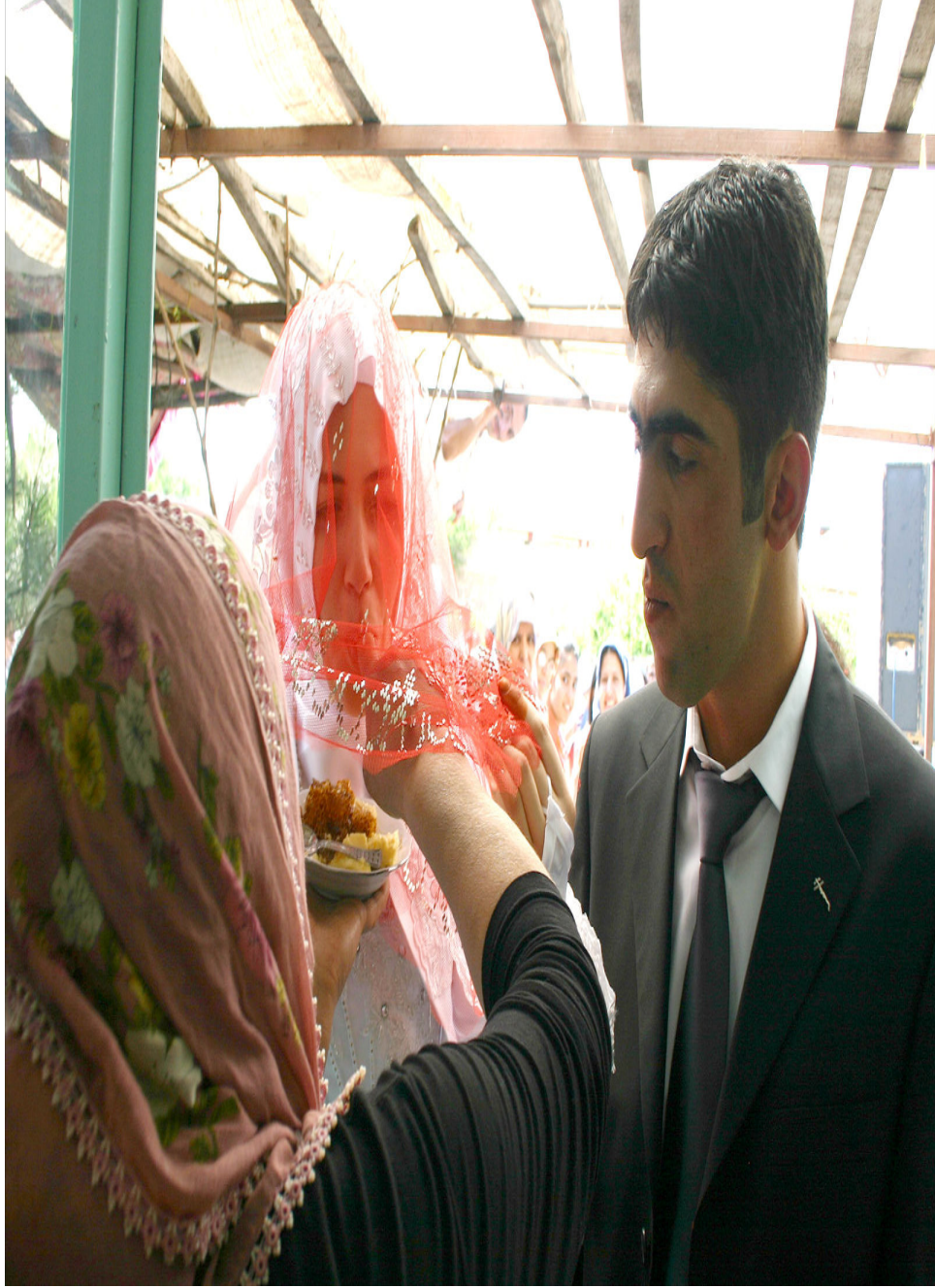
Ek-13. Gelin ve damada bal yedirme