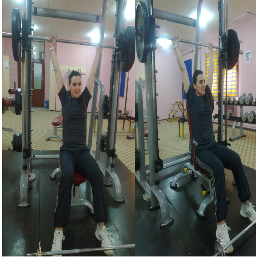
Resim 6. Eğik sehbeda pres

Özel olarak yapılmış "Bench" ismi verilen sıranın üzerine, bacaklar her iki yanda kalacak şekilde yatırılır. Barbell, Bench'in her iki yanında bulunan askıların üzerindedir. Barbell barı, omuz genişliğinden biraz daha geniş tutuş açıklığı ile her iki el ile kavranır. Nefes alınarak köprücük kemiğinin 5 santim kadar daha aşağısına gelecek şekilde indirilir. Yine kontrollü ve yavaşça, kollar tam düzelineye kadar, göğüs kaslarında tam gerginlik hissederek yukarıya kaldırılır. Ellerin tutuş açıklığı omuz genişliğinden daha dar ise, göğüs kaslarının iç kısımları, daha geniş ise, dış ve yan kısımları daha etkili çalışır. Bütün gövdenin kuvvet ve görünüşünü çok olumlu yönde etkileyen en faydalı temel hareketlerin başında gelir (Resim 6).