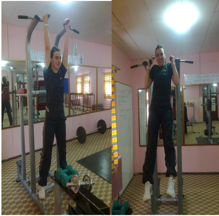
Resim 7. Barfiks

Barfiks hareketi Resim 7’de gösterilmiştir. Vücudu kollar ve eller yardımıyla baş el hizasına kadar çekip sonra kolları tekrar bırakıp(birden değil kontrollü biçimde) bu hareketi tekrarlamaktır. Tek bir hareketle neredeyse üst bedendeki bütün kasları aynı anda çalıştırır.