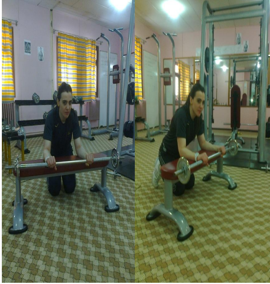
Resim 2. Bankta üst kol çalışması

Bankta üst kol çalışması ; Barbell, Bench'in kenarına oturularak omuz genişliğinden biraz daha dar bir aralıkla ve avuç içleri yukarıya bakacak şekilde, bilekler, dizlerin veya Bench'in kenarına tespit edilerek, sıkıca kavranır. ( Pozitif Tutuş ) Bu durumda sadece eller bileklerden hareket ettirmek ve nefes vermek suretiyle aşağıya doğru indirilir ve tekrar nefes alınarak sadece bileklerin gücüyle ve dirsekleri yerinden hiç kaldırmadan devam edilir (Resim 2).