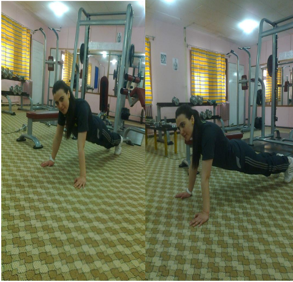
Resim 8. Şınav

Klasik şınav Hareketinde; Yüzükoyun olarak yere uzanılır. Eller omuzların yanına gelecek şekilde konulur. Vücudunuzu elleriniz ve ayak parmaklarınız yerde kalacak şekilde zemine baskı uygulayarak kollarınızla kaldırın. Elleriniz omuz genişliğinden biraz daha açık olacak şekilde açın. Ayaklarınızı birleştirin, kol ve bacaklarınızı gergin duruma getirin. Vücudunuz bu sırada düz bir çizgi oluştursun. (Başlangıç pozisyonu) Dirseklerinizi katlayarak göğsünüzü yere yaklaştırın. Yere ne kadar yaklaşırırsanız o kadar yararlı olacaktır. Zemine baskı uygulayarak kollarınızla vücudunuzu başlangıç pozisyonuna kaldırılır (Resim 8).