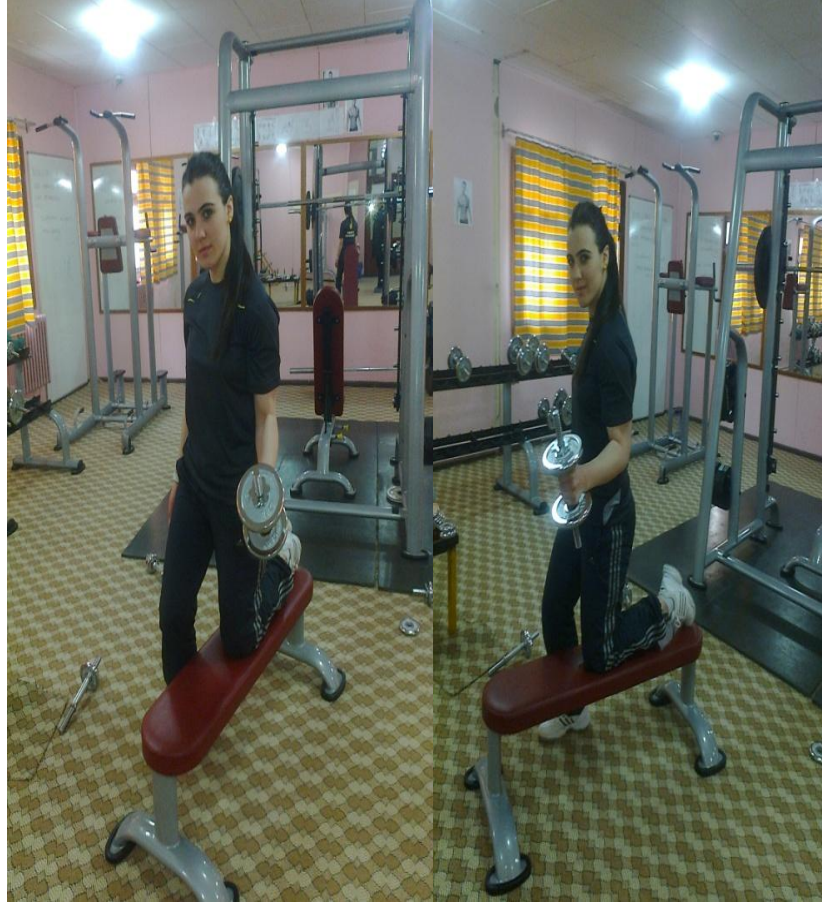
Resim 1: Ağırlıkla çekici çalışması

Resim 1’de görüldüğü üzere; Barbell, Bench'in kenarına diz bırakılır diğer ayak yerde sabit pozisyonunda ve avuç içleri vücuda dönük pozisyonda tutulan dumbbell'lar, dirsekler vücudun yanında sabit kalmak şartıyla, nefes verilerek omuz istikametine doğru sıra ile kaldırılır ve tutuş pozisyonu hiç değiştirilmeden yine nefes alınarak başlangıç durumuna dönülür.