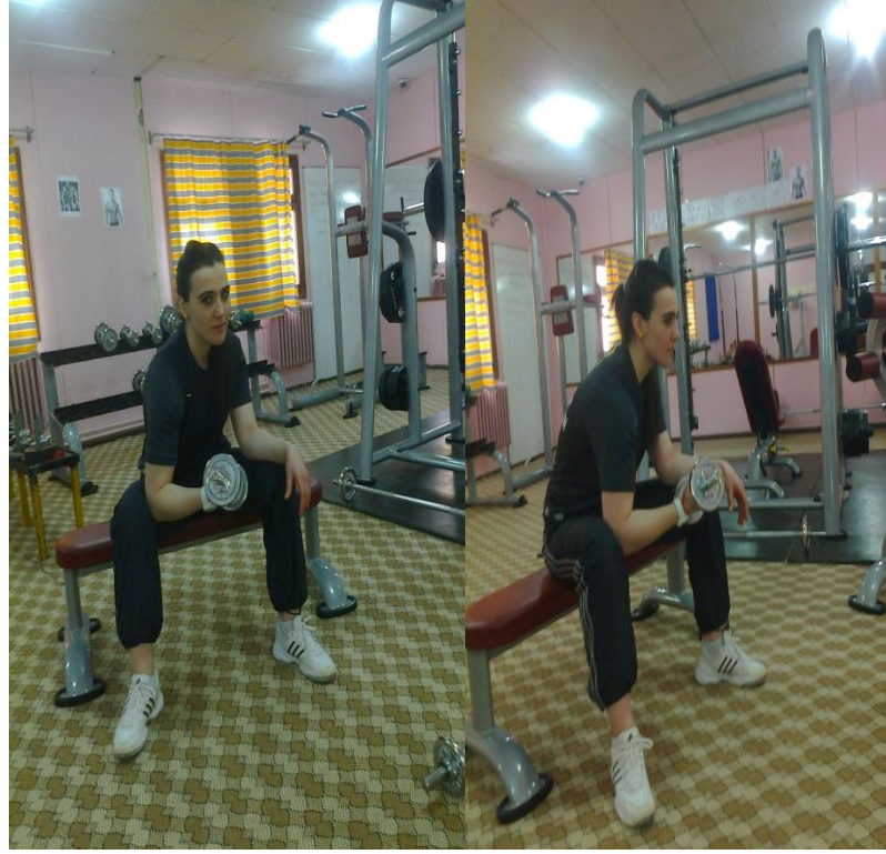
Resim 3. Çömelik pozisyonunda tek kol çalışması

Bench'in kenarına oturularak, dumbbell, avuç içi yukarı bakacak şekilde tek el ile kavranır. Dirsek bacağın iç kısmına yaslanır ve ağırlık, nefes verilerek omuza doğru kaldırılır. Tekrar nefes alınarak başlangıç pozisyonuna, yavaş ve kontrollü olarak indirilir. Biceps kasının alt uçlarını şekillendiren ve onu yükselten bir egzersizdir (Resim 3).