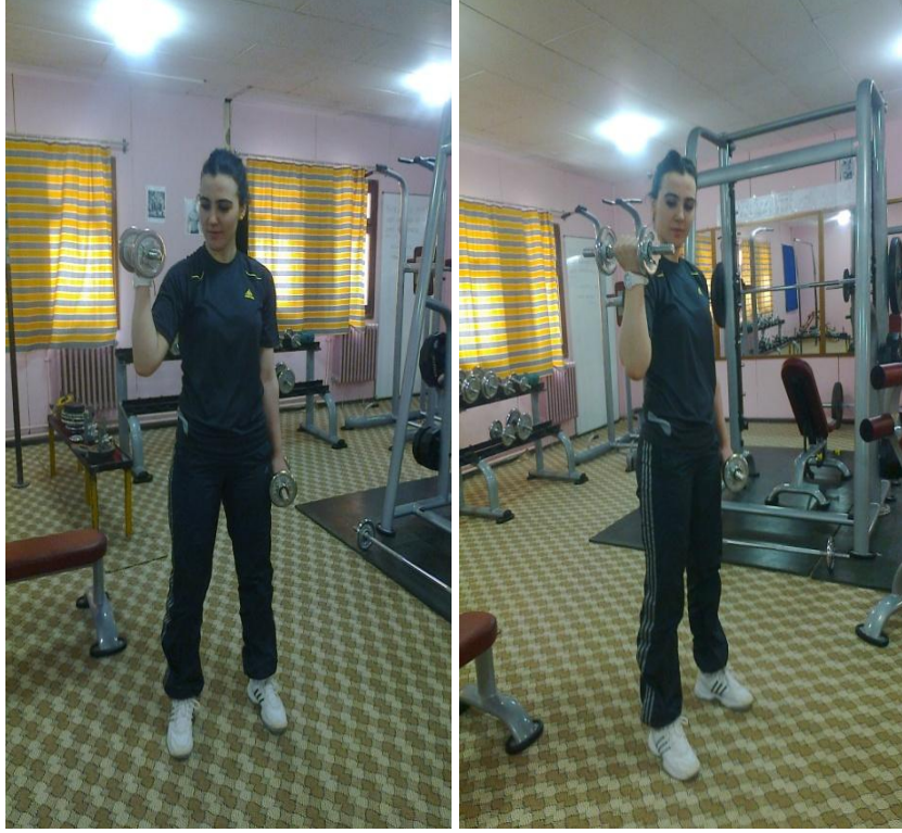
Resim 4. Ayakta Ağrlıkla kol çalışması

Resim 4’de görüldüğü üzere; Ayakta normal duruş pozisyonunda ve avuç içleri vücuda dönük pozisyonda tutulan dumbbell'lar, dirsekler vücudun yanında sabit kalmak şartıyla, nefes verilerek omuz istikametine doğru sıra ile kaldırılır ve tutuş pozisyonu hiç değiştirilmeden yine nefes alınarak başlangıç durumuna dönülür. Yani, hareket, bir dumbbell kaldırılırken, diğeri kontrollü olarak indirilerek uygulanır. Bu hareket tek dumbbell ile de yapılabilir. Hareket devamında dirseklerin öne veya arkaya kaçmasını engellemek ve kasların gevşemesine' izin vermemek gerekir. Biceps kaslarının alt uçlarını şekillendiren ve büyük ön kol kaslarını geliştirerek, kuvvetlendiren güzel bir harekettir.