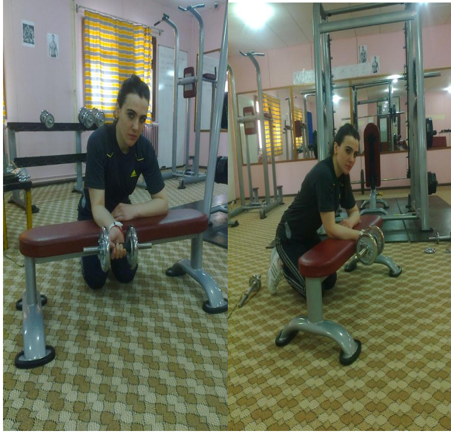
Resim 5. Çömelik pozisyonda bilek çalışması

Her iki ele veya tek ele alınan dumbbell'lar bilekler diz üstünde veya bench'in kenarından dışarıya sarkacak şekilde omuz genişliği kadar bir açıklıkla ve avuç içleri yukarı bakacak şekilde tutulur. Bu arada dirsekler bench'in üzerinde sabit ve hareketsizdir. Bu durumda dumbbell'lar sadece bileklerin kontrollü ve yavaşça aşağı ve yukarı hareketiyle kaldırılarak tamamlanır (Resim 5).